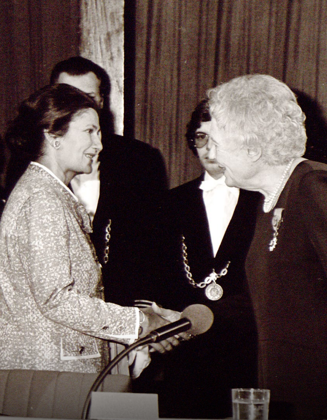
Louise Weiss ag cur fáilte roimh Simone Veil a bhí nua-thoifa ina hUachtarán Pharlaimint na hEorpa. 17 Iúil 1979.