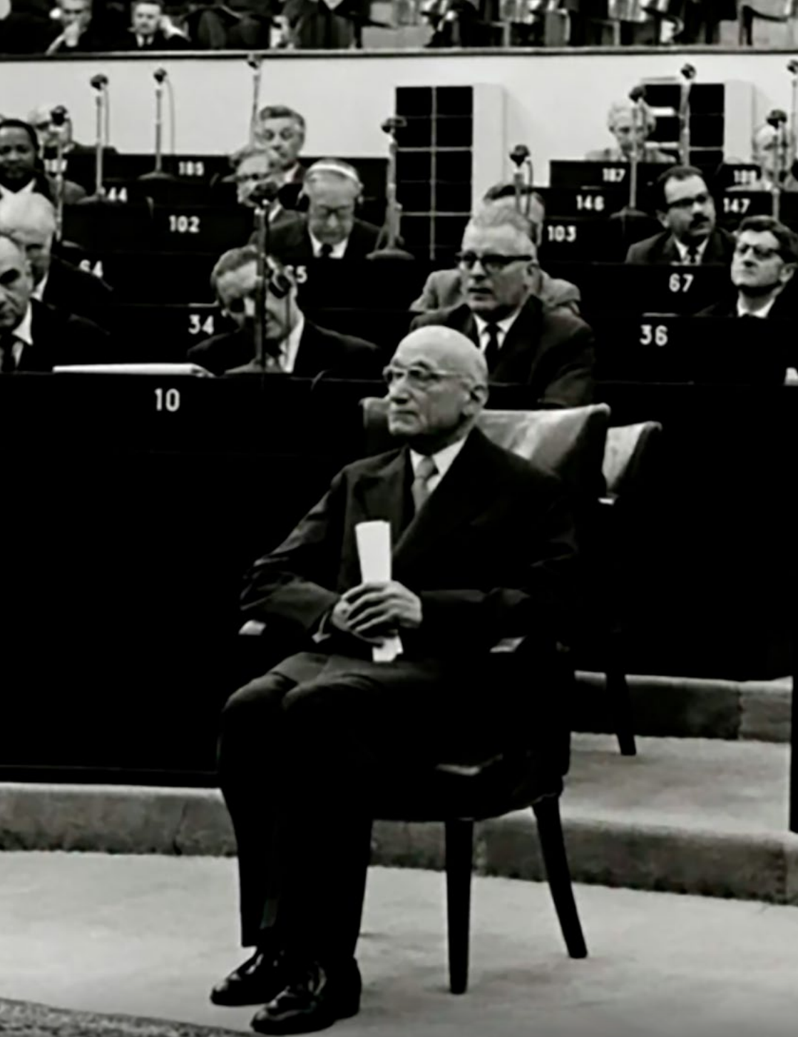
Robert Schuman i dTionól Parlaiminteach na hEorpa, ar ócáid chomóradh 10 mblíana de Dhearbhú Schuman. 10 Bealtaine 1960.