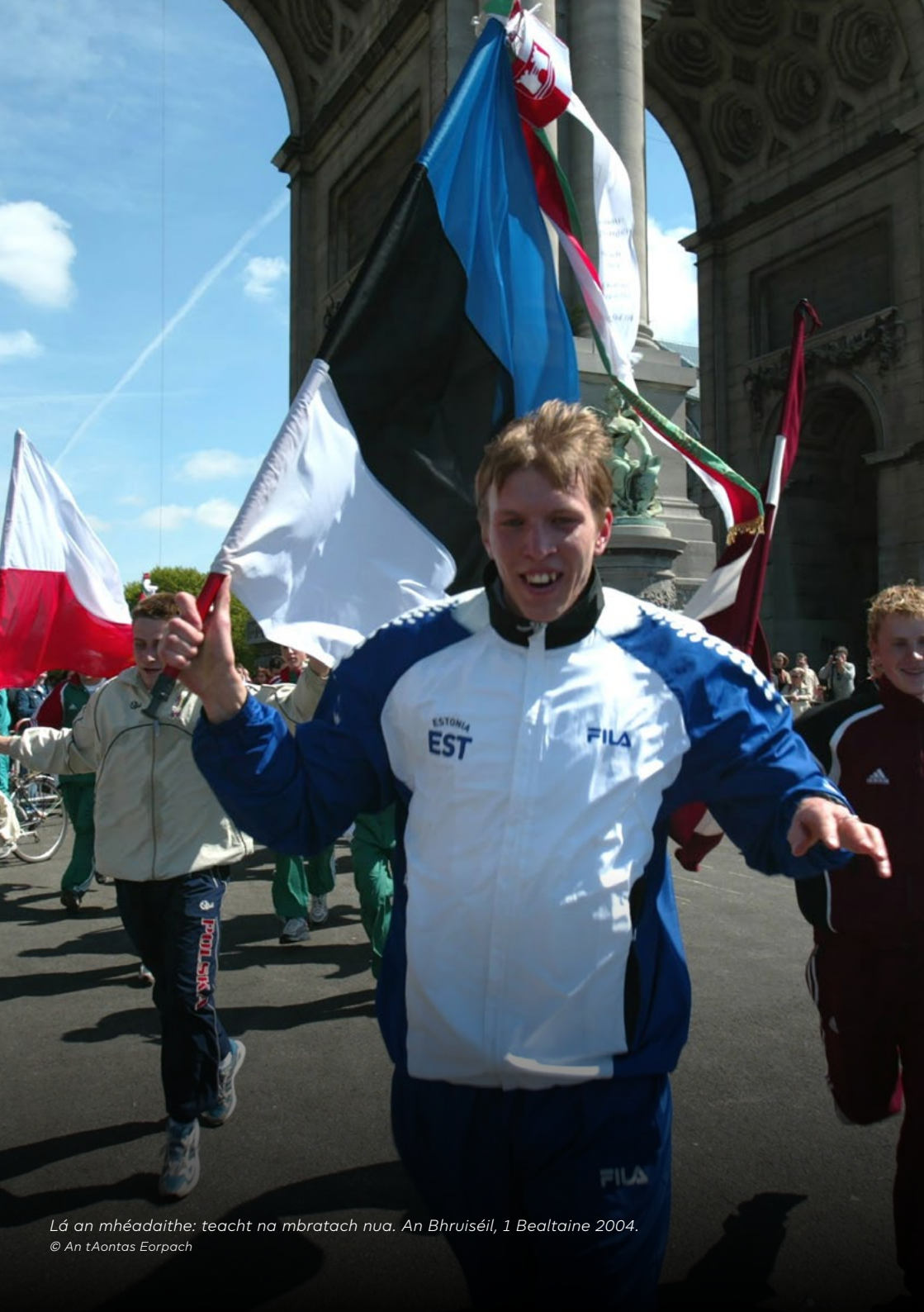
Lá an mhéadaíthe: teach na mbratach nua. An Bhruiséil, 1 Bealtaine 2004.