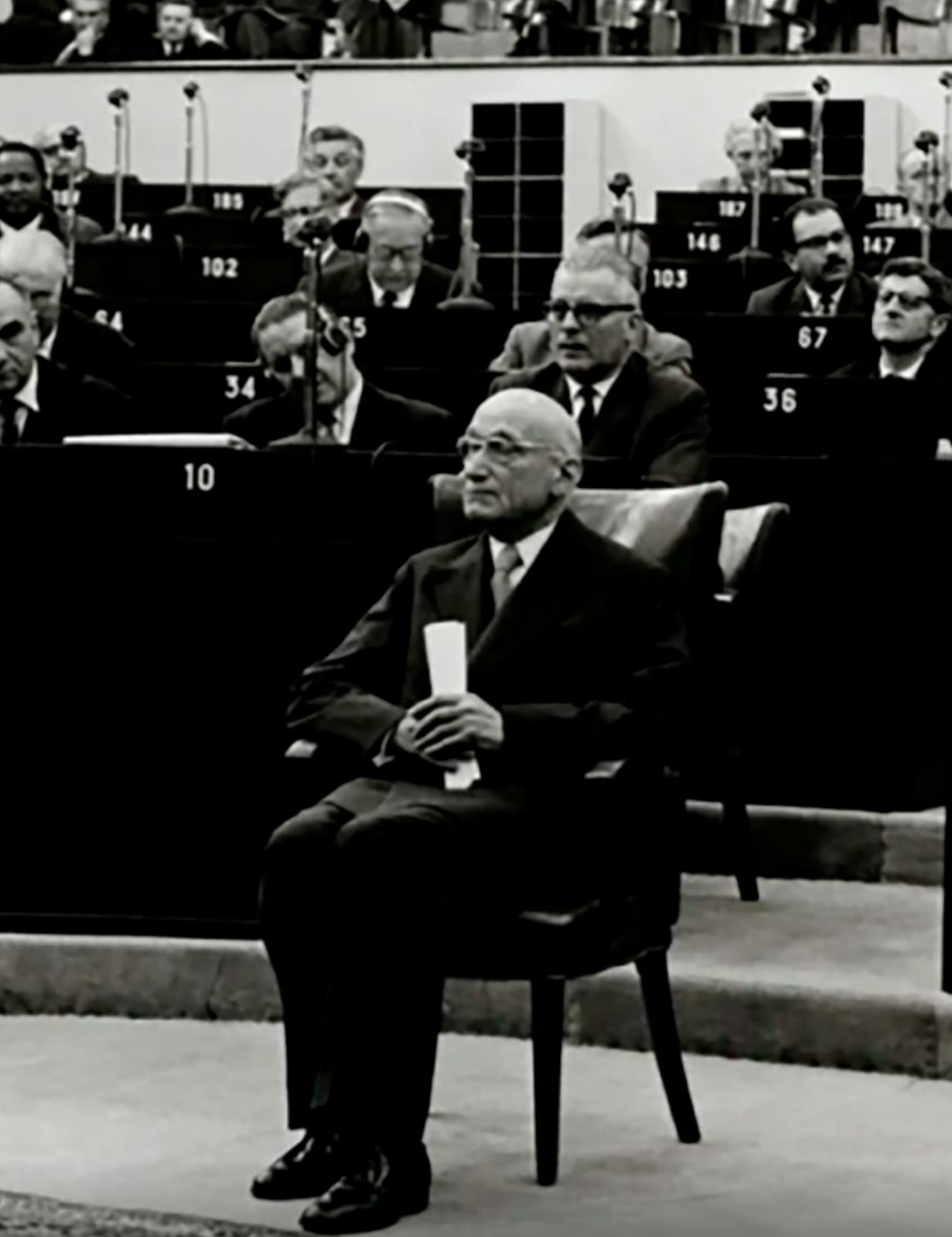
Robert Schuman v Evropském parlamentním shromáždění u příležitosti 10. výročí Schumanovy deklarace. 10. května 1960