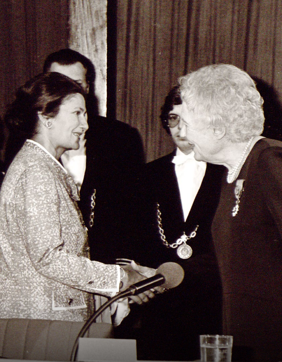
Louise Weissová vítá Simone Veilovou po jejím zvolení předsedkyní Evropského parlamentu. 17. července 1979