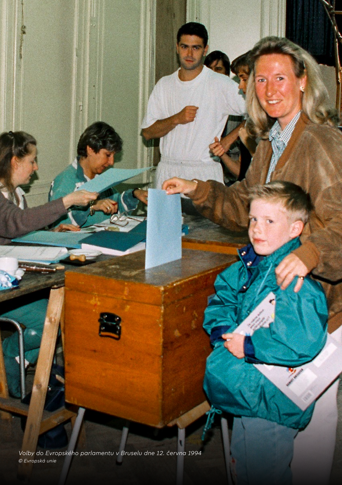
Volby do Evropského parlamentu v Bruselu dne 12. června 1994