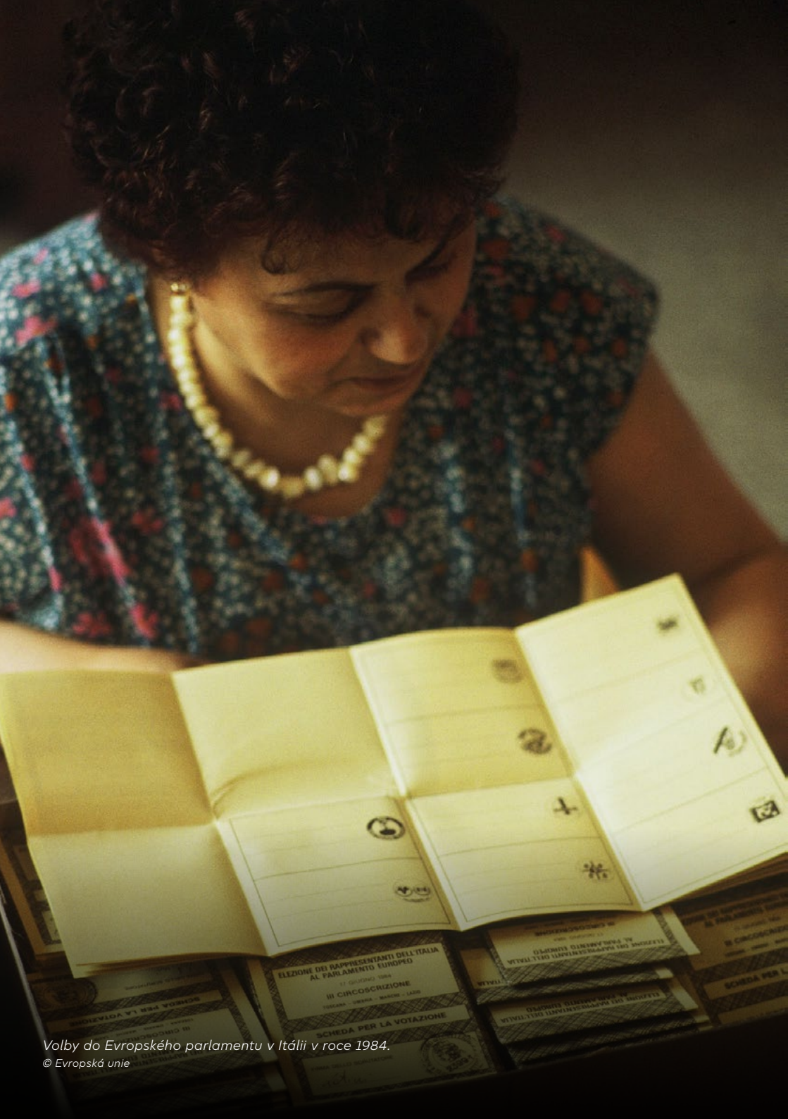
Volby do Evropského parlamentu v Itáli v roce 1984.