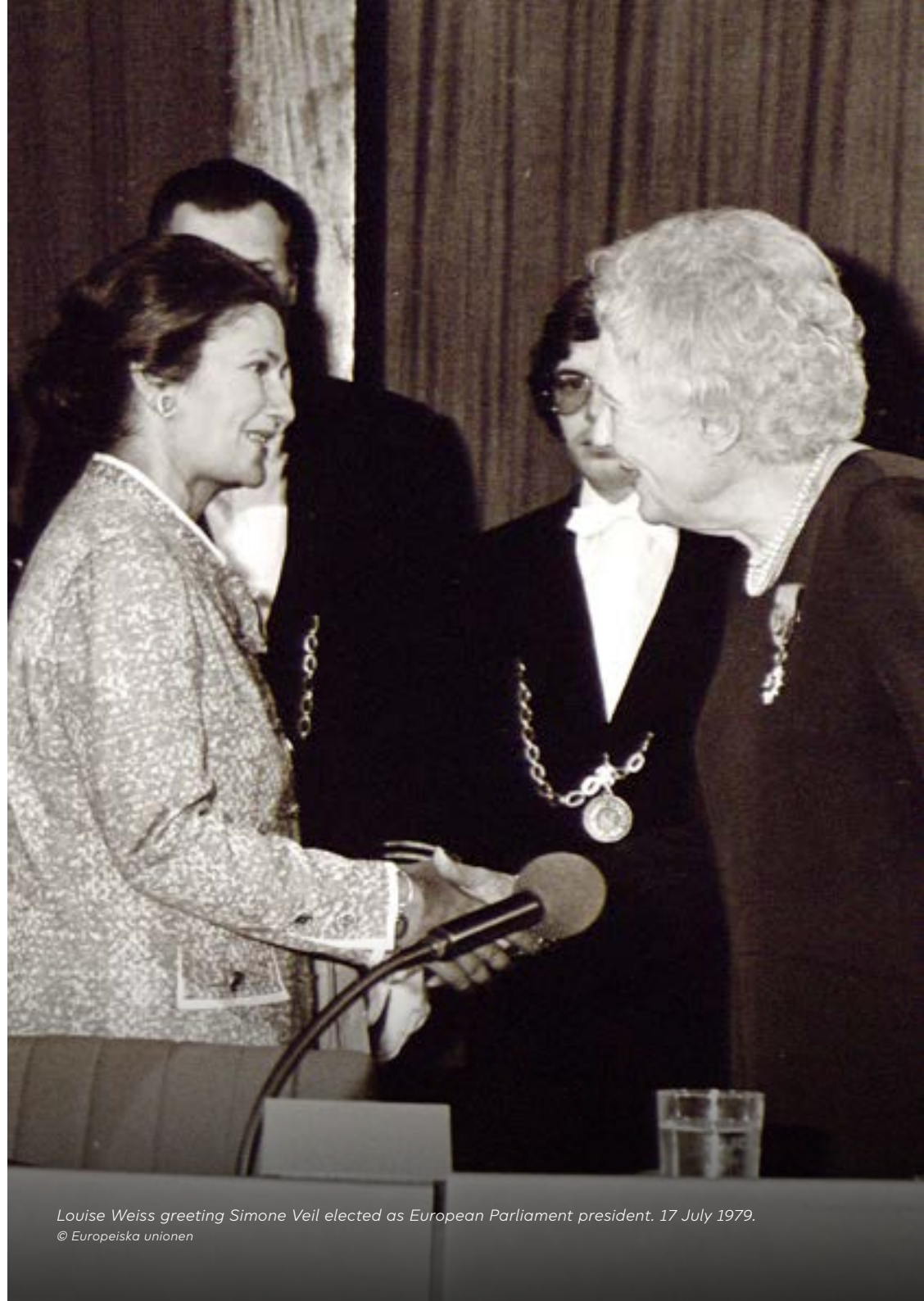
Louise Weiss greeting Simone Veil elected as European Parliament president. 17 July 1979.

Under den andra hälften av valperioden, med början från 1982, valdes Piet Dankert från Nederländerna till talman.