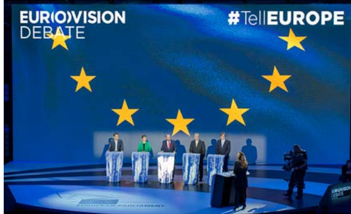
Direktsänd debatt 2014 mellan kandidaterna till posten som EU-kommissionens ordförande.

Under efterföljande valperiod stod parlamentsledamöterna inför snabba förändringar både i och utanför EU. I mitten av 2016 beslutade en majoritet av de brittiska medborgarna, i den första folkomröstningen av sitt slag, att Storbritannien skulle lämna Europeiska unionen. Det blev också nödvändigt att utfärda varningar till några av medlemsländernas regeringar som rörde sig i riktning mot "illiberal demokrati". Valet av Donald Trump som USA:s president 2016 ledde till mer ansträngda relationer mellan EU och USA.