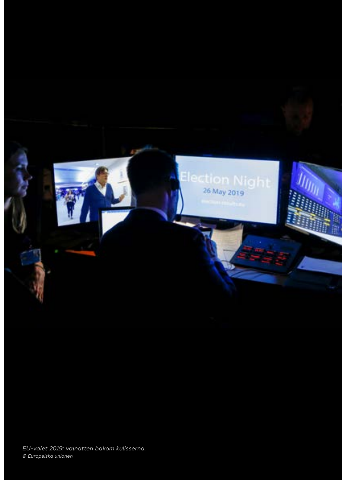
EU-valet 2019: valnatten bakom kulisserna.

Klimatet och miljöskyddsfrågor fick en framträdande roll under 2019 års EU-val eftersom den globala miljöförstörelsen hela tiden såg ut att bli mer akut. Under valperioden blev det också dags för Storbritannien att slutgiltigt lämna EU. 2020 var året då coronapandemin bröt ut. De europeiska institutionerna beslutade 2021 att sammankalla till konferensen om Europas framtid, som ett sätt att blicka framåt. 2022 invaderades Ukraina av Ryssland.