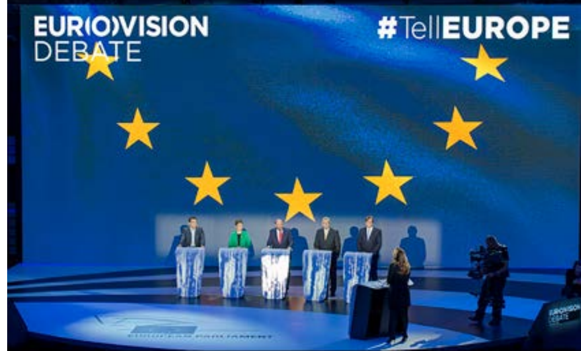
Eurovíziós vita 2014-ben az Európai Bizottság elnökjelöltjei között.

Az európai parlamenti képviselőknek a teljes ciklus során nagyszabású változásokkal kellett szembenézniük mind belföldön, mind külföldön. 2016 derekán a brit állampolgárok többsége váratlanul úgy döntött, hogy nem akarnak többé az Európai Unió része lenni. Néhány tagállam kormányát figyelmeztetni kellett, hogy elindultak az illiberális demokráciává válás útján. Donald Trump amerikai elnökké választása 2016-ban feszültségekhez vezetett az EU és az Egyesült Államok közötti kapcsolatokban.