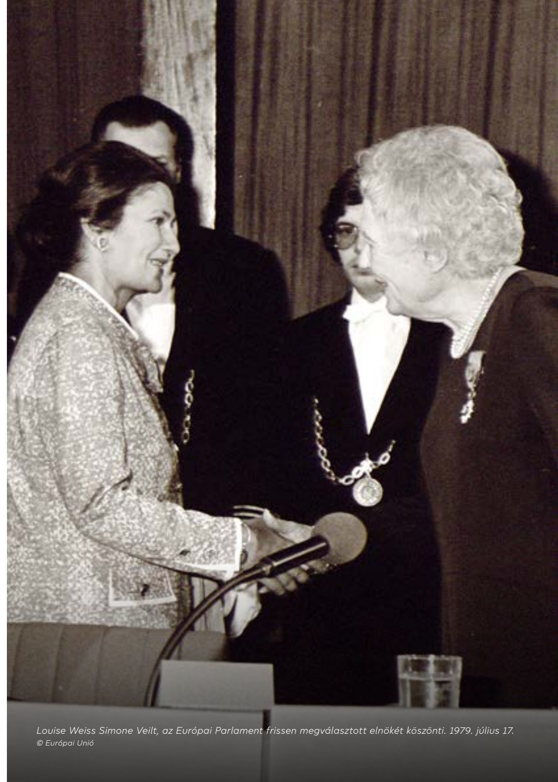
Louise Weiss Simone Veilt, az Európai Parlament frissen megválasztott elnökét köszönti. 1979. július 17.

A parlamenti ciklus második felében, 1982-től a Parlament elnöki tisztét a holland Piet Dankert töltötte be.