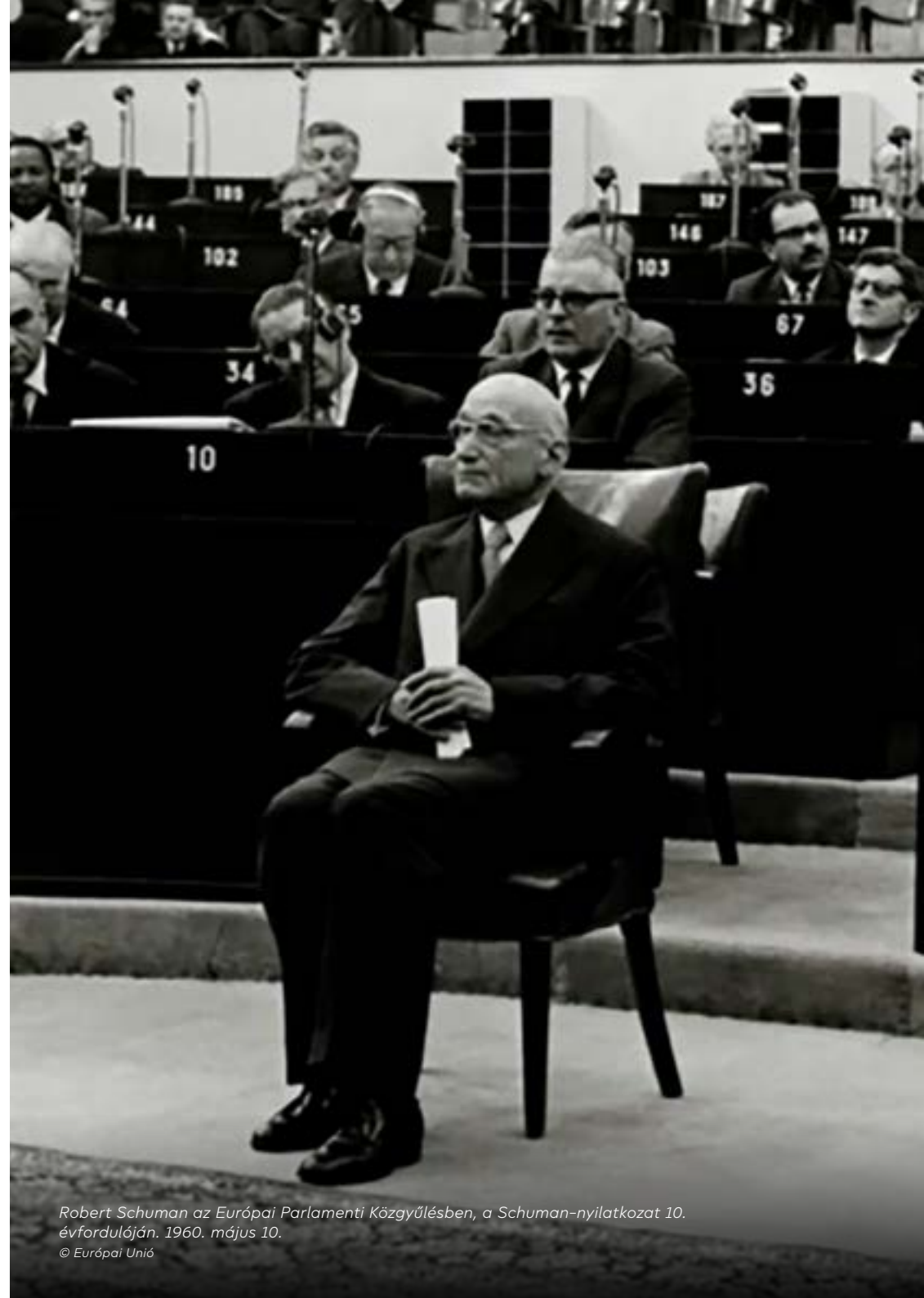
Robert Schuman az Európai Parlamenti Közgyűlésben, a Schuman-nyilatkozat 10. évfordulóján. 1960. május 10.

1958-ban két további európai közösség jött létre: az Európai Gazdasági Közösség és az Euratom. A mindhárom Közösség képviselőjében eljáró új testület, az Európai Parlamenti Közgyűlés első elnöke az a (korábban francia külügyminiszter és miniszterelnök) Robert Schuman lett, aki Monnet egyesült Európára vonatkozó tervének nyilvános arca volt, és híres nyilatkozatában a világ nyilvánossága elé tárta a tervet.