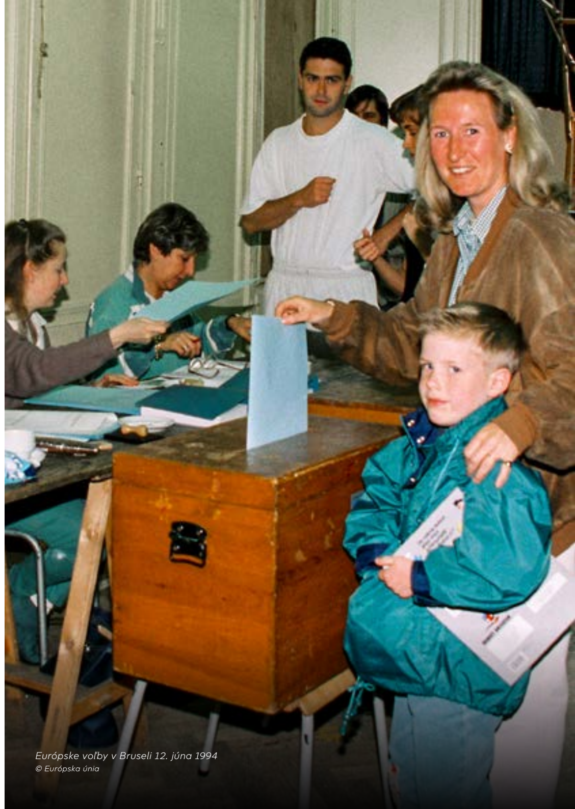
Európske voľby v Bruseli 12. júna 1994

Volebná účasť bola približne 57 %. Za predsedu Európskeho parlamentu bol v roku 1994 zvolený Nemeck Klaus Hänsch. Predsedom na druhú polovicu volebného obdobia sa v roku 1997 stal Španiel José María Gil-Robles. Keďže EÚ sa k 1. januáru 1995 rozrástla z 12 na 15 členských štátov, Rakúsko, Švédsko a Fínsko si svojich zástupcov zvolili v čiastočných voľbách v rokoch 1995 a 1996. Nové členské krajiny so sebou priniesli silnú tradíciu neutrálnosti a vysokých štandardov v sociálnej a environmentálnej oblasti. Svet sa na Európu pozeral novými očami: na starom kontinente zavládol optimizmus a európsky model podľa všetkého prekonal model niekdajších blokov z čias studenej vojny.