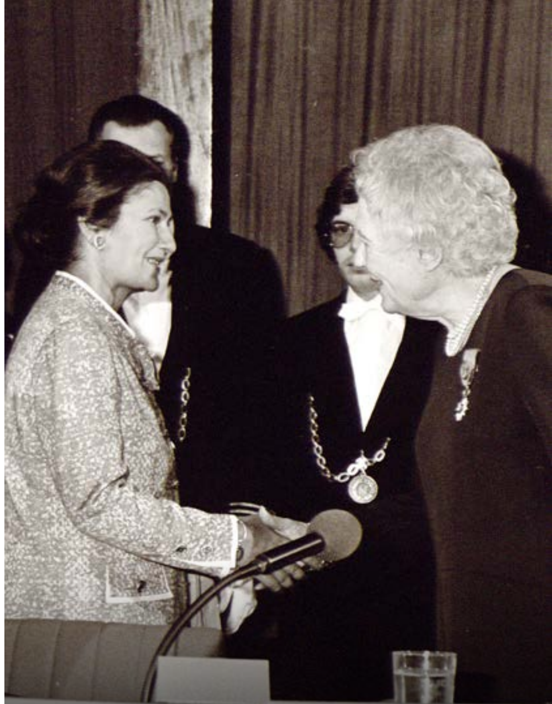
Louise Weissová zdraví novozvolenú predsedníčku Európskeho parlamentu Simone Veilovú. 17. júla 1979.

V druhej polovici volebného obdobia, ktoré sa začalo v roku 1982, bol predsedom Holanďan Piet Dankert.