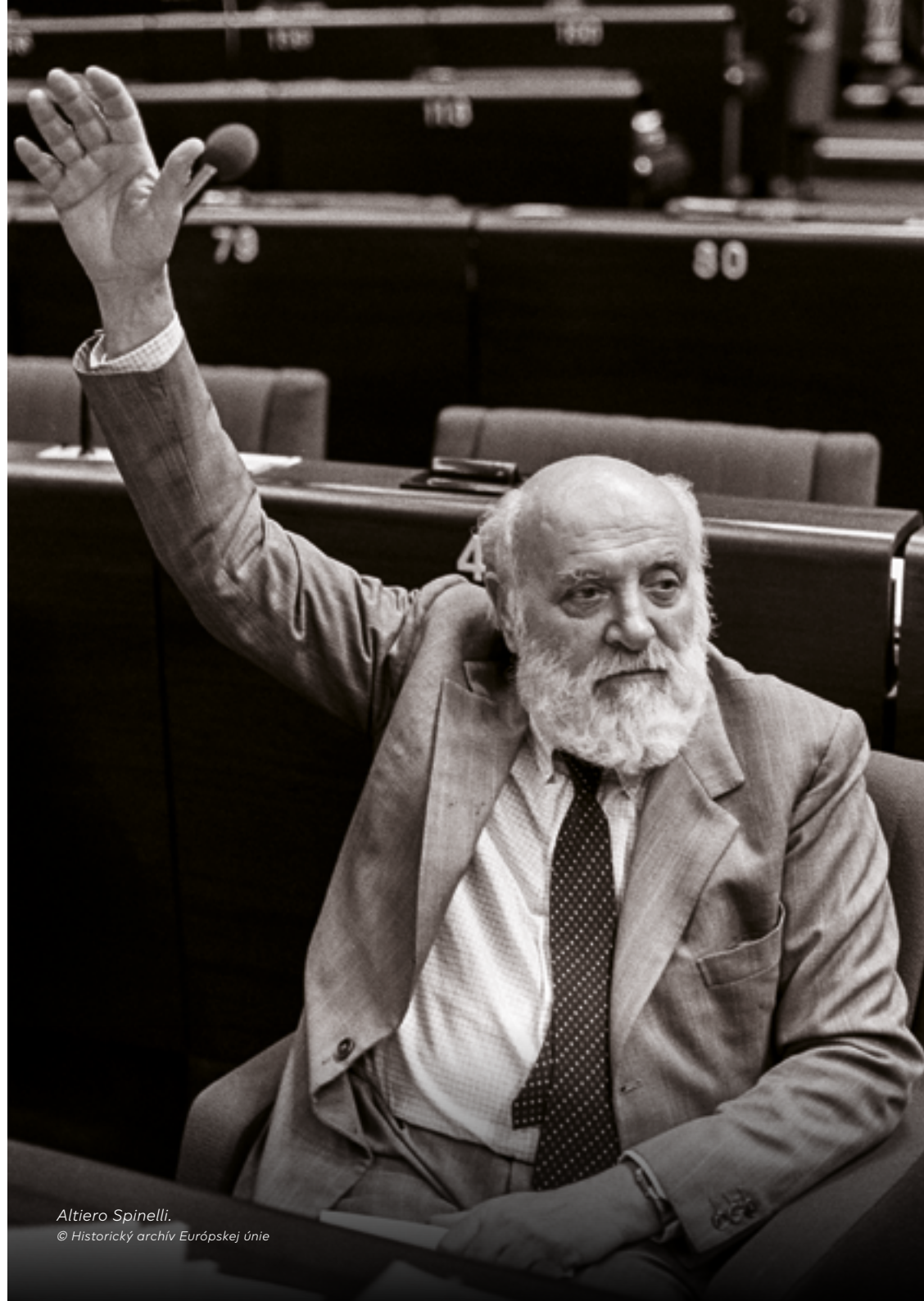
Altiero Spinelli.

Grécko sa zúčastnilo na európskych voľbách po prvýkrát ako plnohodnotný členský štát. Volebná účasť dosiahla 59 %. Predsedom Európskeho parlamentu sa stal francúzsky politik Pierre Pflimlin ako prvý bývalý premiér členského štátu. V roku 1987 ho vystriedal britský politik Charles Henry Plumb. Keďže Španielsko a Portugalsko sa stali členmi Európskeho spoločenstva v polovici volebného obdobia, v roku 1987 sa konali čiastočné voľby. Hoci členské štáty nakoniec návrh Zmluvy o založení Európskej únie neschválili, išlo o prelomový dokument, ktorý položil základy pre ďalší vývoj. Viedol k schváleniu Jednotného európskeho aktu a napokon i k vzniku Európskej únie.