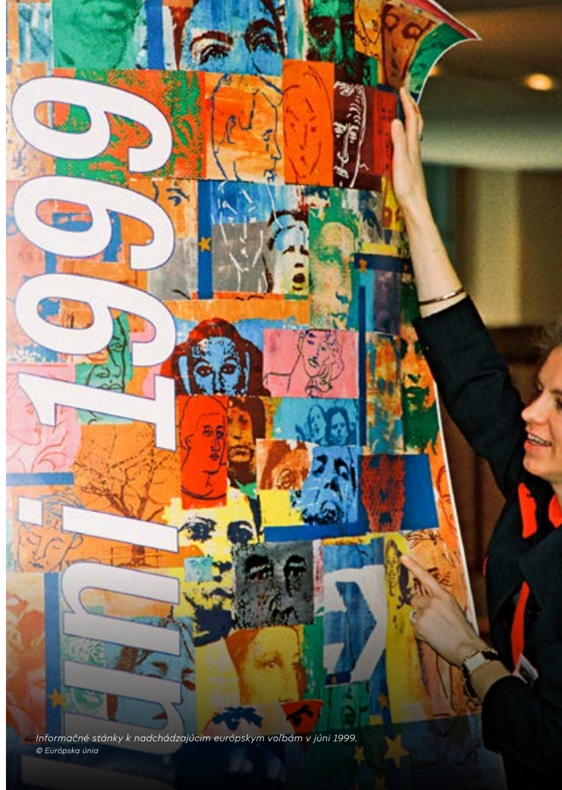
Informačné stánky k nadchádzajúcim európskym voľbám v júni 1999.

Volebná účasť bola 58 %. V roku 1999 bola za predsedníčku Európskeho parlamentu zvolená francúzska politička Nicole Fontainová, ktorá úrad zastávala počas prvej polovice volebného obdobia. V roku 2002 ju na tomto poste vystriedal írsky politik Pat Cox, ktorý na ňom zotrval v priebehu druhej polovice volebného obdobia. Pôsobenie tohto Parlamentu charakterizovalo uvedenie eura do obehu 1. januára 2002, ako aj zriadenie konventu na vypracovanie európskej ústavy. Popritom však bola Európska únia ako svetový aktér postavená pred veľké výzvy. Po útokoch 11. septembra 2001 v New Yorku a vo Washingtone sa predmetom diskusií v doposiaľ nevidanej miere stal boj proti terorizmu. Invázia USA do Iraku rozdelila Úniu na dva tábory: jedna skupina krajín bola na strane Spojených štátov, zatiaľ čo druhá sa k tomuto kroku opakovane stavala kriticky, čo dokonca viedlo k rozlišovaniu medzi „starou“ a „novou Európou“.