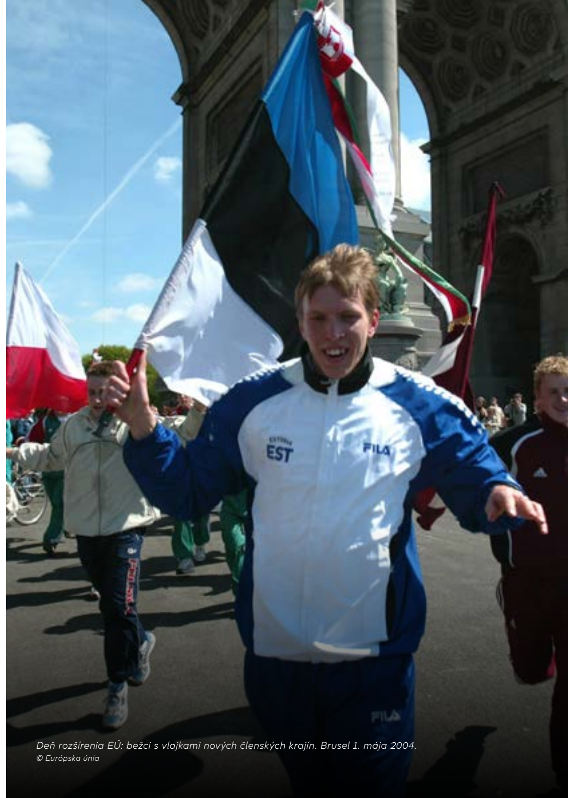
Deň rozšírenia EÚ: bežci s vlajkami nových členských krajín. Brusel 1. mája 2004.

Nie všetok pokrok dosiahnutý pri formovaní novej Európy však vyšiel nazmar: po odmietnutí Ústavnej zmluvy nasledovalo tzv. obdobie reflexie. Otázka znela: čo ďalej? Berlínske vyhlásenie, ktoré v marci 2007 podpísal okrem iných aj predseda Pöttering, zachránilo mnohé ustanovenia Ústavnej zmluvy včas pred nasledujúcimi voľbami v podobe neskôr podpísanej Lisabonskej zmluvy (pôvodne známej ako „Reformná zmluva“).