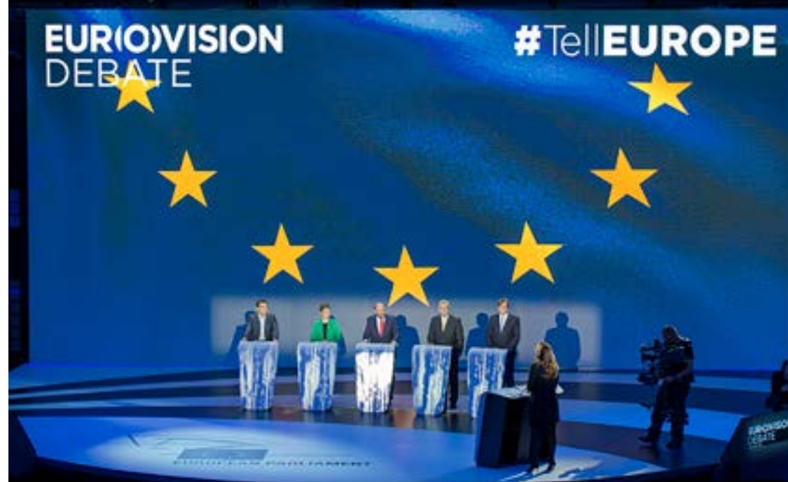
Diskusia televíznej siete Eurovízia v roku 2014 medzi kandidátmi na predsedu Európskej komisie.

Počas nasledujúceho volebného obdobia boli poslanci EP konfrontovaní s rýchlo sa meniacou situáciou tak na domácej, ako aj na zahraničnej scéne. V polovici roka 2016 väčšina britských občanov po bezprecedentnom hlasovaní rozhodla o vystúpení svojej krajiny z Európskej únie. Vládam niektorých členských štátov, ktoré sa posúvali smerom k „neliberálnej demokracii“, bolo nutné adresovať príslušné upozornenie. Zvolenie Donalda Trumpa za prezidenta USA v roku 2016 vyvinulo tlak na vzťahy medzi EÚ a USA.