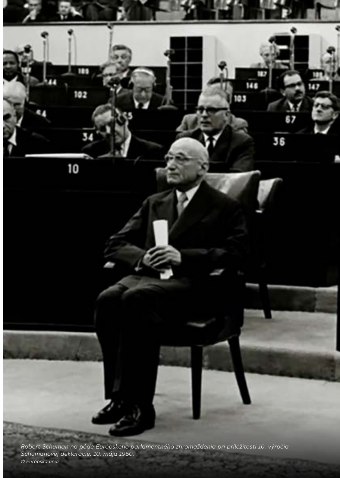
Robert Schuman na pôde Európskeho parlamentného zhromaždenia pri príležitosti 10. výročia Schumanovej deklarácie. 10. mája 1960.

V roku 1958 vznikli ďalšie európske spoločenstvá – Európske hospodárske spoločenstvo a Európske spoločenstvo pre atómovú energiu (Euratom). Bývalý francúzsky premiér a minister zahraničných vecí Robert Schuman, ktorý Monnetov plán zjednotenej Európy verejne podporoval a oznamoval celému svetu, sa stal predsedom nového zákonodarného orgánu, ktorý združoval zástupcov všetkých troch spoločenstiev – Európskeho parlamentného zhromaždenia.