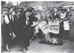
Louise Weiss bij een betoging samen met andere suffragettes, mei 1935.