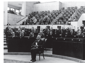
Robert Schuman in de Europese Parlementaire Vergadering ter gelegenheid van de tiende verjaardag van de Schuman-verklaring op 10 mei 1950.