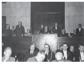
Voorzitter Paul-Henri Spaak aan het woord in de vergaderzaal van de Gemeenschappelijke Vergadering op 11 september 1952.