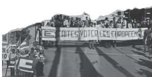
[Achtergrondfoto] Betoging voor algemene Europese verkiezingen, Straatsburg, 1972.