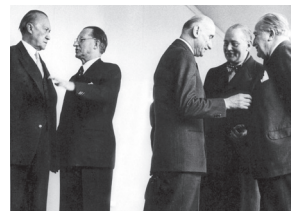
Ministers van de lidstaten van de Europese Gemeenschap voor Kolen en Staal ontmoeten elkaar in Straatsburg, december 1951. Alcide De Gasperi, de tweede van links, werd later de tweede voorzitter van de Gemeenschappelijke Vergadering.