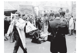
Betogingen in de marge van de Top van Den Haag op 1 en 2 december 1969. Op de Top van Den Haag werd de Europese integratie nieuw leven ingeblazen nadat deze bijna tien jaar eerder was stilgevallen.