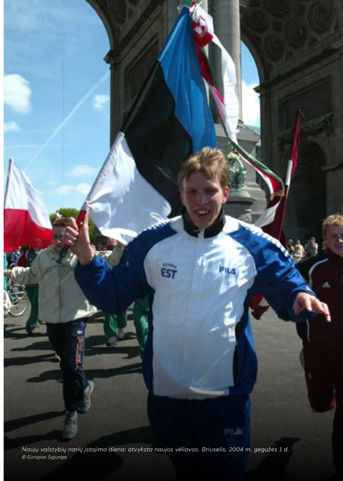
Naujų valstybių narių įstojimo diena: atvyksta naujos vėliavos. Briuselis, 2004 m. gegužės 1 d.

Tačiau prarastas ne visas naujosios Europos kūrimo darbas. Atmetus Sutartį dėl Konstitucijos prasidėjo apmąstymų laikotarpis: kas toliau? Berlyno deklaracija, kurią 2007 m. kovo mėn. pasirašė ir Pirmininkas H. G. Pöttering, prieš kitus rinkimus išgelbėjo daugelį Sutarties dėl Konstitucijos nuostatų ir vėliau jos tapo Lisabonos sutartimi (iš pradžių vadinta Reformų sutartimi).