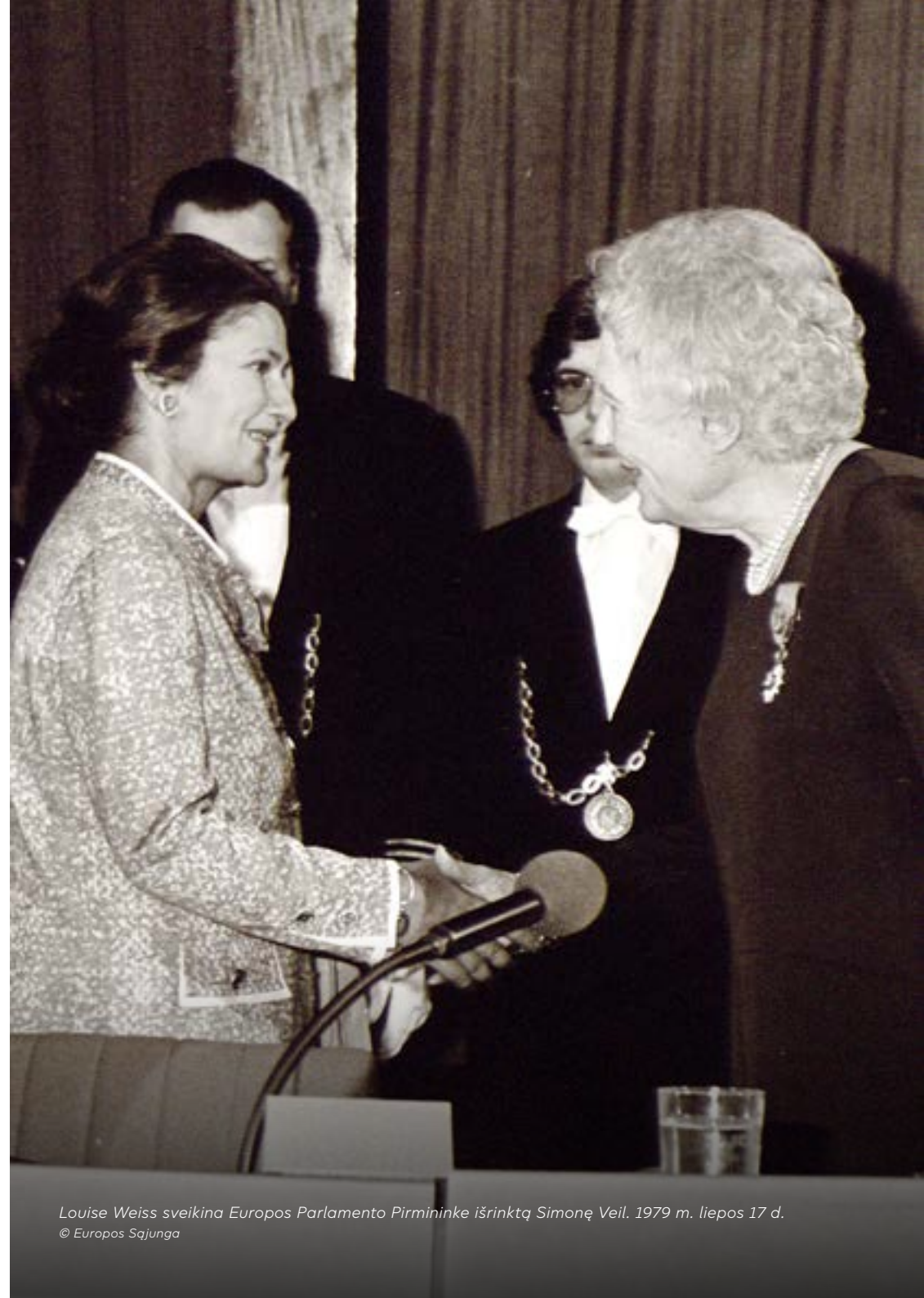
Louise Weiss sveikina Europos Parlamento Pirmininke išrinktą Simone Veil. 1979 m. liepos 17 d.

1982 m. įpusėjus Europos Parlamento kadencijai, jo pirmininku tapo Piet Dankert iš Nyderlandų.