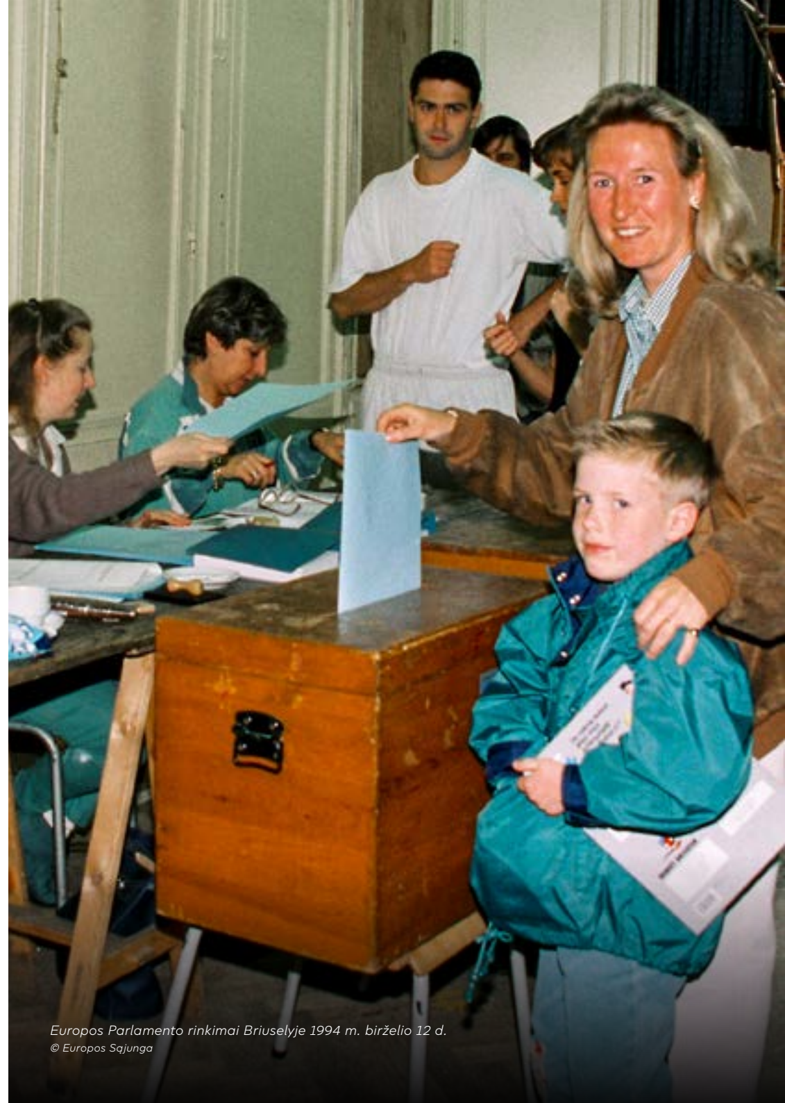
Europos Parlamento rinkimai Briuselyje 1994 m. birželio 12 d.

Rinkėjų aktyvumas siekė 57 %. 1994 m. Europos Parlamento pirmininku buvo išrinktas vokiečių Klaus Hänsch. Tuomet 1997 m. įpusėjus kadencijai, pirmininkavimą perėmė ispanas José María Gil-Robles. Kadangi 1995 m. sausio 1 d. ES valstybių narių skaičius padidėjo nuo 12 iki 15, savo atstovus 1995 m. ir 1996 m. daliniuose rinkimuose išrinko Austrija, Švedija ir Suomija. Šios visiškai naujos narės su savimi atsinešė tvirtas savarankiškumo ir aukštų socialinių bei aplinkos standartų tradicijas. Pasaulis taip pat į Europą žvelgė naujomis akimis: Senajame žemyne suklestėjo naujos optimistinės idėjos ir buvo tikima, kad Europos modelis bus geresnis už Šaltojo karo blokų modelius.