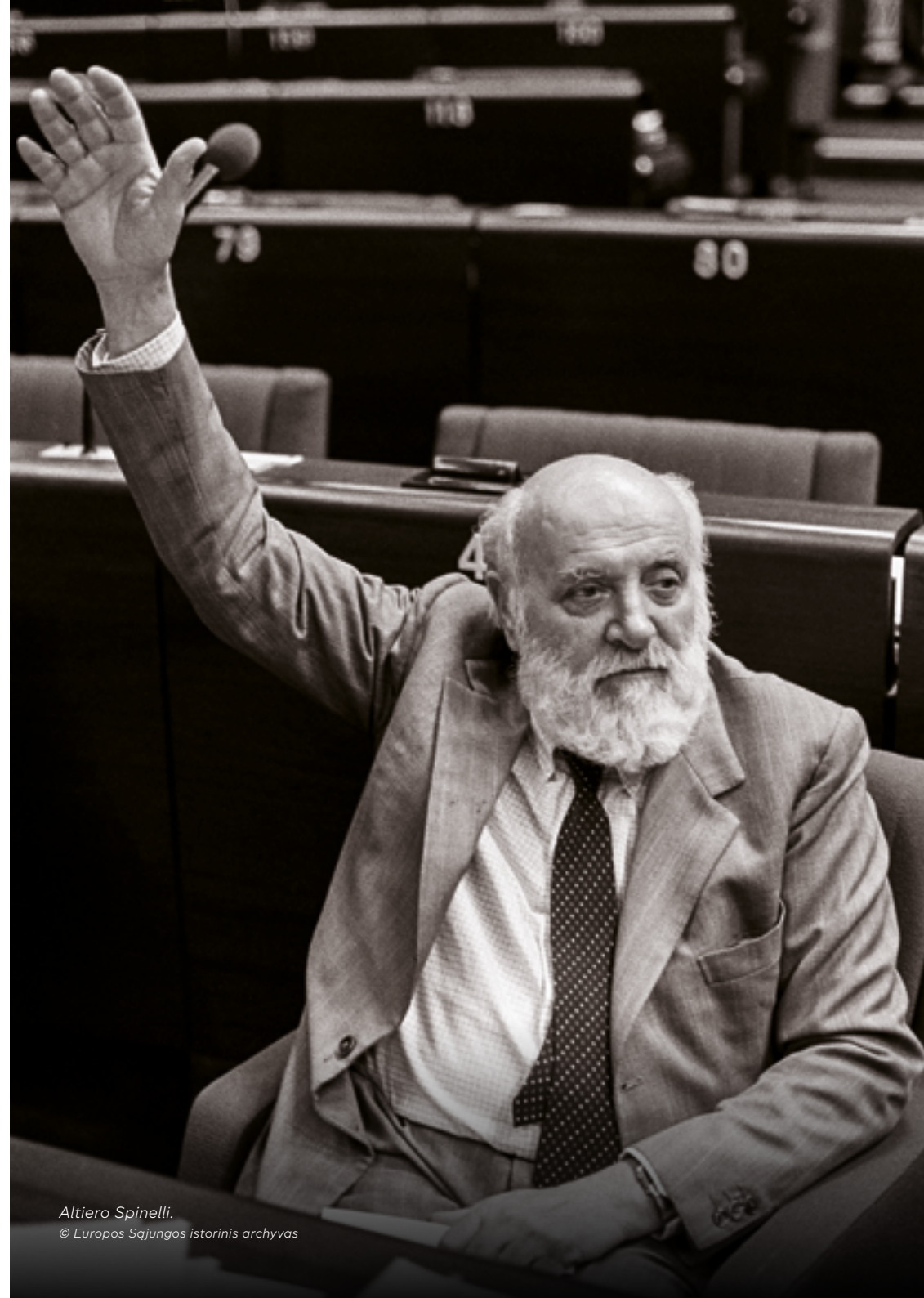
Altiero Spinelli.

Tais metais Europos Parlamento rinkimai pirmą kartą įvyko pilnateisėje valstybėje narėje Graikijoje. Šį kartą rinkėjų aktyvumas siekė 59 %. Europos Parlamento pirmininku buvo išrinktas buvęs Prancūzijos ministras pirmininkas Pierre Pflimlin. Tai buvo pirmas kartas, kai Europos Parlamentui vadovavo buvęs valstybės narės premjeras. Tuomet nuo 1987 m. pirmininkavimą perėmė Charles Henry Plumb iš Jungtinės Karalystės. Kadangi Ispanija ir Portugalija į Europos bendriją įstojo įpusėjus Europos Parlamento kadencijai, jose 1987 m. buvo surengti daliniai rinkimai. Nors valstybės narės nepatvirtino Europos Sąjungos steigimo sutarties projekto, jis paskatino esminius ateities pokyčius, kaip antai Suvestinio Europos akto patvirtinimas ir galiausiai Europos Sąjungos įsteigimas.