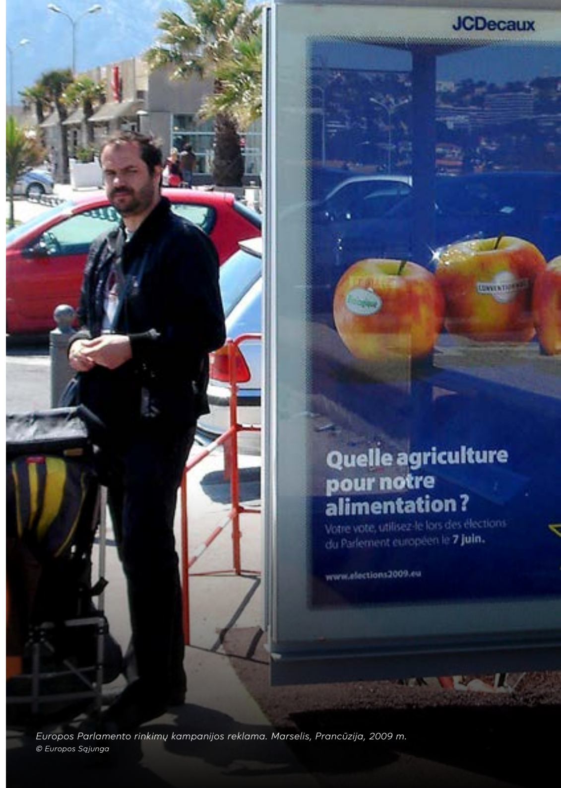
Europos Parlamento rinkimų kampanijos reklama. Marselis, Prancūzija, 2009 m.

2010 m. grėsmė, kad Graikija nevykdys su jos skolomis susijusių įsipareigojimų, sukėlė Europos valstybių skolų krizę. Tuo tarpu po Airijos finansinės krizės daugelis valstybių narių patyrė finansinių sunkumų ir bendras įsiskolinimas pasiekė pavojingą ribą. Per tą Europos Parlamento kadenciją taip pat vyko neramumai prie Sąjungos sienų: 2010 m. prasidėjęs Arabų pavasaris 2011 m. išplito ir tais pačiais metais įsiplieskė karas Sirijoje. 2013 m. Kyjive prasidėjo „Euromaidano“ protestai, o 2014 m. Rusija aneksavo Krymą ir Donbase kilo karas.