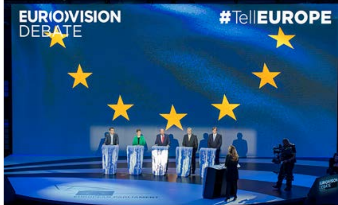
2014 m. kandidatai į Europos Komisijos pirmininko postą Eurovizijos diskusijoje.

Per tą kadenciją EP nariai susidūrė su staigiais aplinkos pokyčiais tiek Europos sąjungos viduje, tiek už jos ribų. 2016 m. viduryje įvyko precedento neturintis dalykas: Jungtinės karalystės piliečiai nusprendė, kad jų šalis turėtų pasitraukti iš Europos Sąjungos. Kai kurių valstybių narių vyriausybės buvo įspėtos, kad jos slysta „neliberalios demokratijos“ link. 2016 m. JAV prezidentu išrinkus Donaldą Trumpą, ES ir JAV santykiai tapo įtempti.