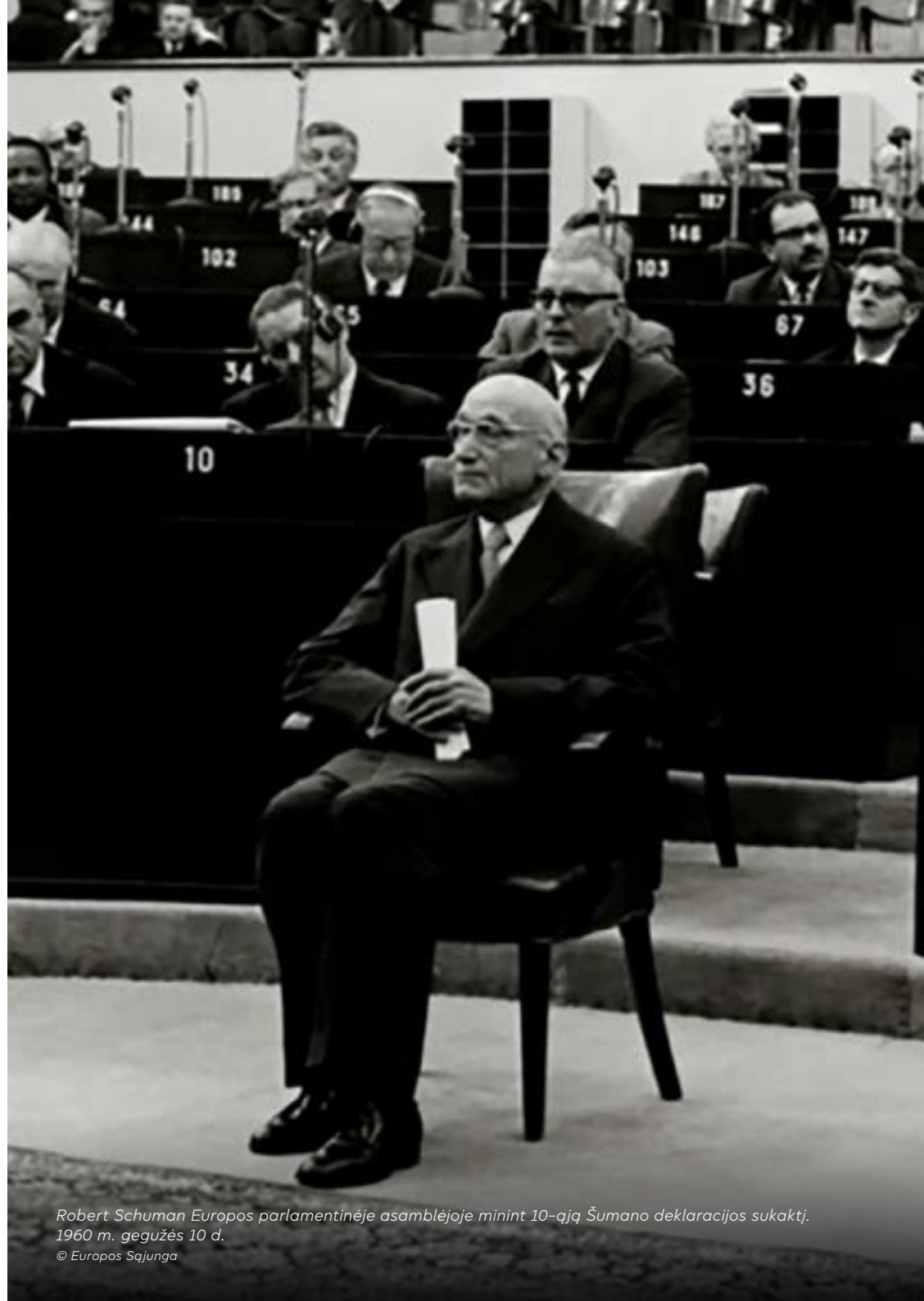
Robert Schuman Europos parlamentinėje asamblėjoje minint 10-ąją Šumano deklaratijos sukaktį. 1960 m. gegužės 10 d.

1958 m. buvo įsteigtos dar dvi Europos bendrijos: Europos ekonominė bendrija ir EURATOMAS. Buvęs Prancūzijos ministras pirmininkas ir užsienio reikalų ministras Robert Schuman, viešai patvirtinęs ir pasauliui paskelbęs J. Monnet Europos suvienijimo planą, tapo visų trijų bendrijų atstovus suvienijusios teisėkūros institucijos – Europos parlamentinės asamblėjos – pirmininku.