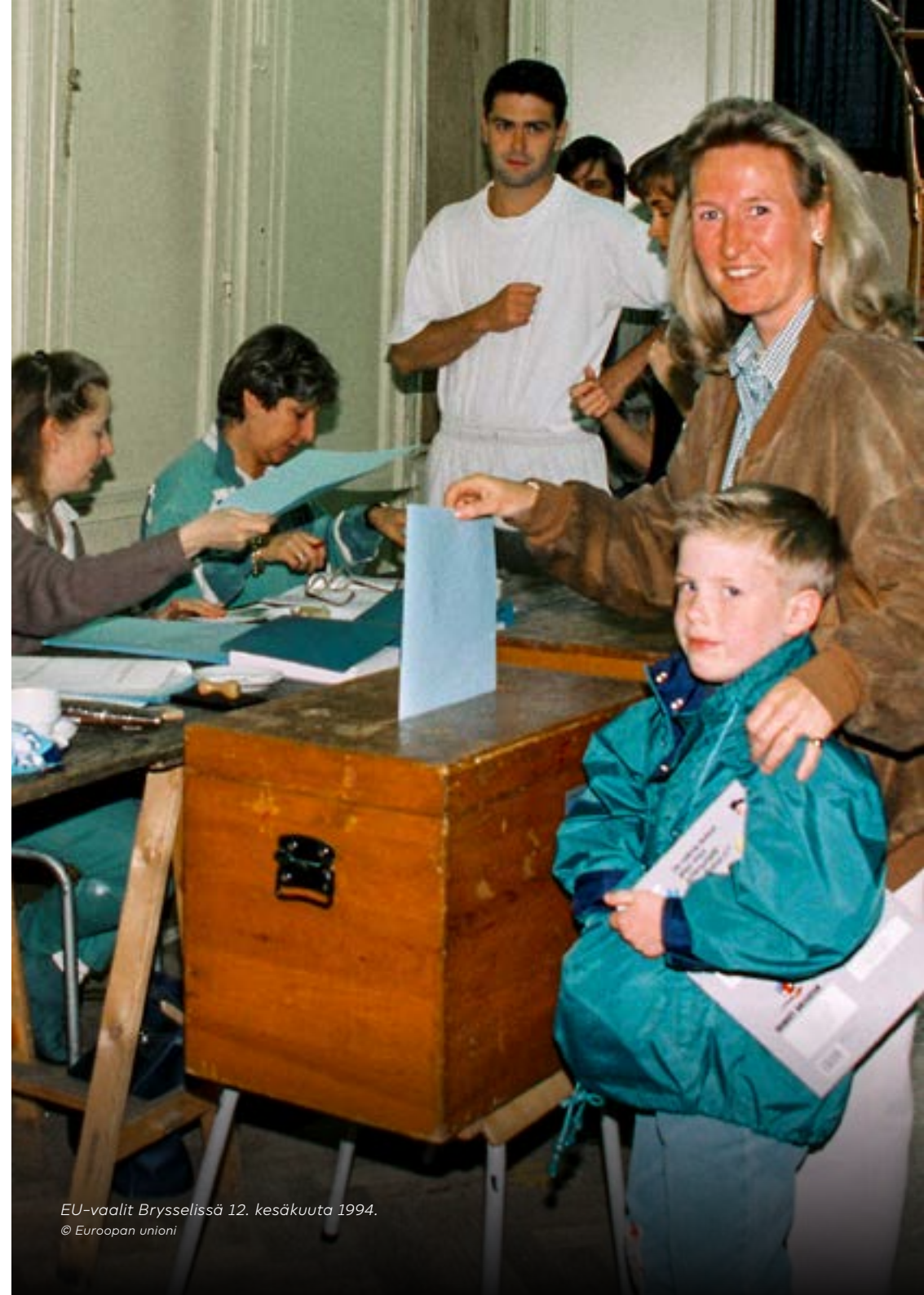
EU-vaalit Brysselissä 12. kesäkuuta 1994.

Vaalien äänestysprosentti oli noin 57. Saksalainen Klaus Hänsch valittiin Euroopan parlamentin puhemieheksi vuonna 1994. Espanjalaisesta José María Gil-Roblesistä tuli puhemies vaalikauden toisen puoliskon ajaksi vuonna 1997. Koska EU:n jäsenmäärä oli 1. tammikuuta 1995 kasvanut 12:sta 15:een, Itävalta, Ruotsi ja Suomi valitsivat edustajansa välikaaleissa vuosina 1995 ja 1996. Nämä uudet jäsenet toivat mukanaan vahvat perinteet liittoutumattomuudesta sekä korkeista sosiaali- ja ympäristöstandardeista. Myös maailma katsoi Eurooppaa uudella tavalla: vanhassa maailmassa alkoi uusi optimistinen ajanjakso, ja EU:n malli näytti olevan omiaan lyömään entisten kylmän sodan blokkien mallin.