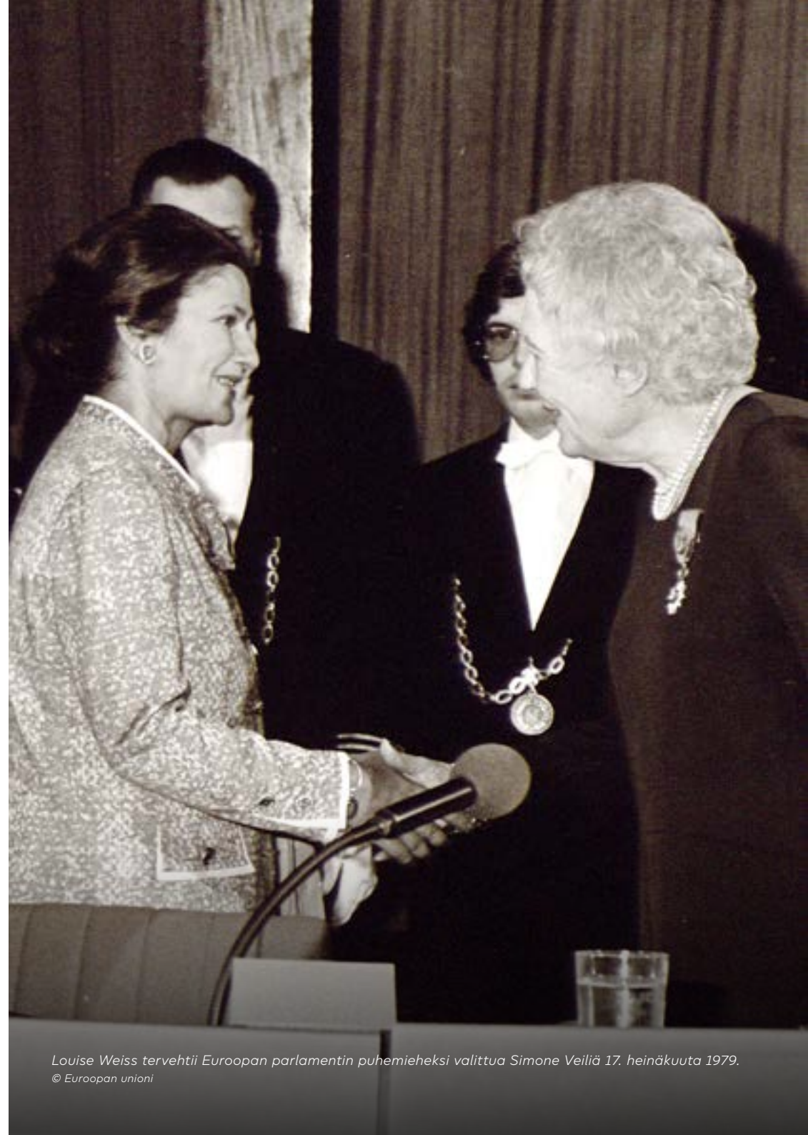
Louise Weiss tervehtii Euroopan parlamentin puhemieheksi valittua Simone Veiliä 17. heinäkuuta 1979.

Se oli myös ensimmäinen kerta, kun Euroopan parlamentin vaalit järjestettiin Kreikan ollessa täysivaltainen jäsenvaltio. Ranskalainen Pierre Pflimlin valittiin äänestysprosentilla 59 parlamentin puhemieheksi. Hänestä tuli ensimmäinen jäsenvaltion entinen pääministeri, joka johti Euroopan parlamenttia. Ison-Britannian Charles Henry Plumb toimi puhemiehenä vuodesta 1987 lähtien. Koska Espanja ja Portugali liittyivät Euroopan yhteisöön kesken vaalikauden, niitä varten suunniteltiin välivaaleja vuonna 1987. Vaikka jäsenvaltiot eivät lopulta hyväksyneet luonnosta sopimukseksi Euroopan unionin perustamisesta, teksti pohjusti tietä tuleville käänteentekeville tapahtumille, kuten Euroopan yhtenäisasiakirjan hyväksymiselle ja lopulta Euroopan unionin perustamiselle.