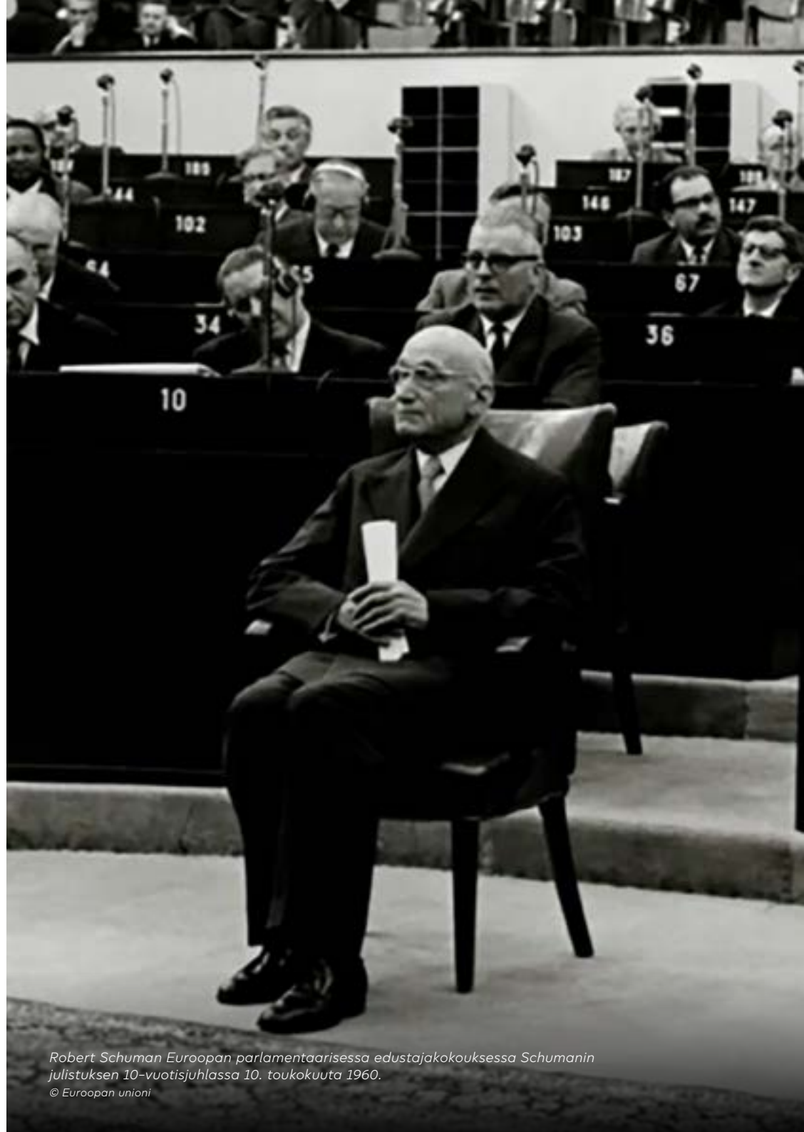
Robert Schuman Euroopan parlamentaarisessa edustajakokouksessa Schumanin julistuksen 10-vuotisjuhlassa 10. toukokuuta 1960.

Vuonna 1958 perustettiin vielä kaksi Euroopan yhteisöä: Euroopan talousyhteisö ja Euratom. Ranskan entinen pääministeri ja ulkoministeri Robert Schuman oli julkisesti tukenut Monnet'n suunnitelmaa yhdistyneestä Euroopasta. Hänestä tuli kaikkien kolmen yhteisön edustajien yhdistävän uuden lainsäätäjän, Euroopan parlamentaarisen edustajakokouksen, puhemies.