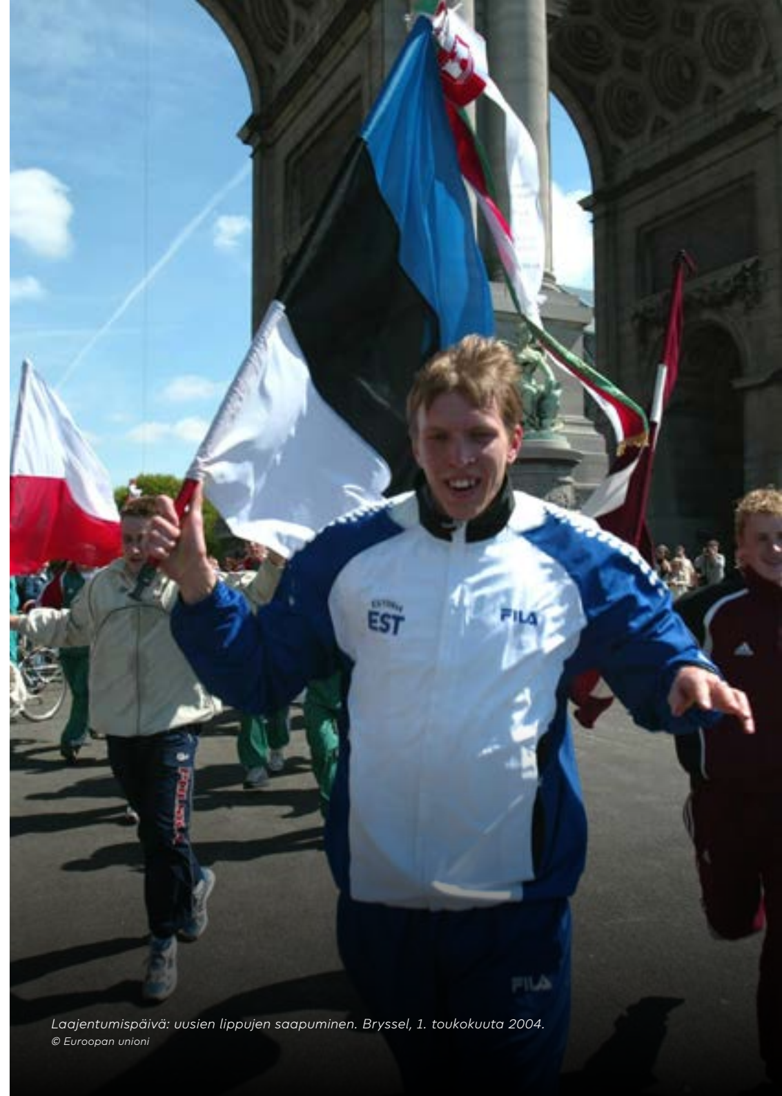
Laajentuspäivä: uusien lippujen saapuminen. Bryssel, 1. toukokuuta 2004.

Kaikki edistysaskeleet uuden Euroopan muotoutumisessa eivät kuitenkaan menneet hukkaan: perustuslakiosopimuksen hylkäämisen jälkeen seurasi pohdinta-aika. Mitä pitäisi tehdä seuraavaksi? Puhemies Pöttering allekirjoitti maaliskuussa 2007 Berliinin julistuksen, johon sisällytettiin monet perustuslakiosopimuksen määräykset ennen seuraavia vaaleja. Siitä tuli myöhemmin Lissabonin sopimus (joka tunnettiin alun perin uudistussopimuksena).