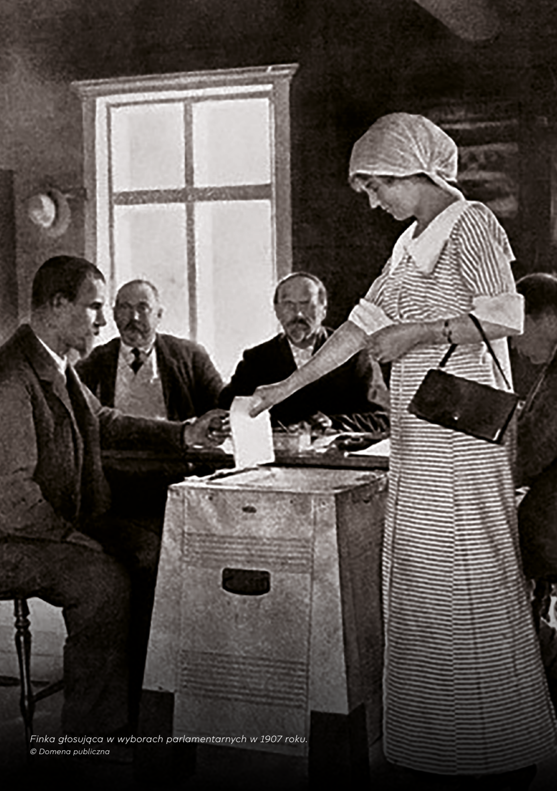
Finka głosząca w wyborach parlamentarnych w 1907 roku.