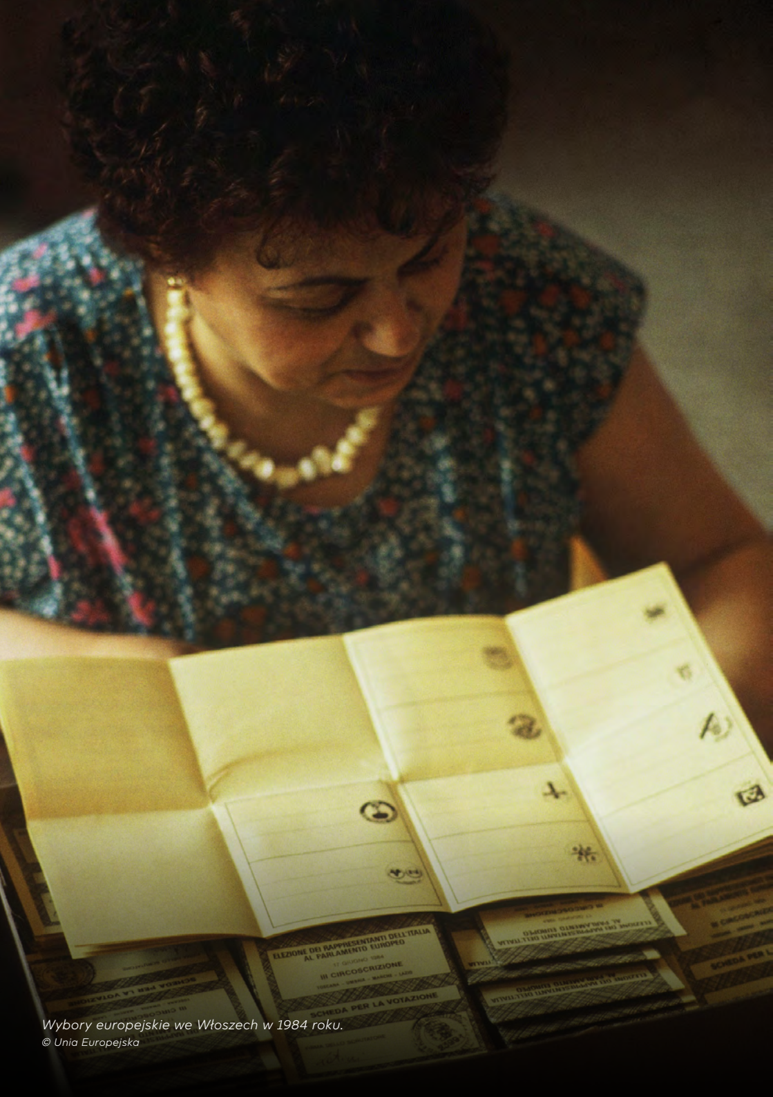
Wybory europejskie we Włoszech w 1984 roku.