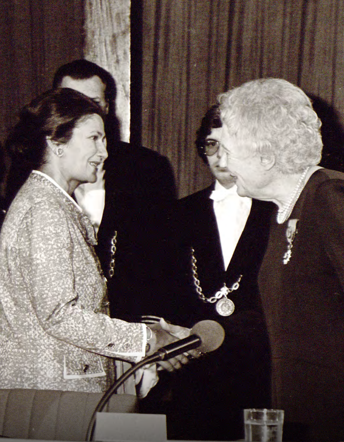
Louise Weiss wita Simone Veil wybraną na przewodniczącą Parlamentu Europejskiego. 17 lipca 1979 roku.