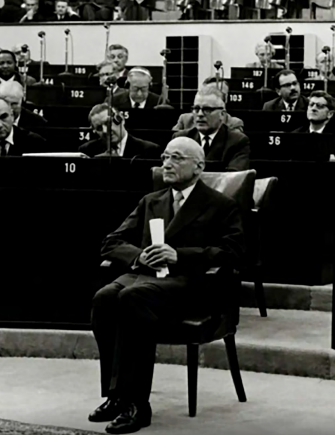
Robert Schuman na Europejskim Zgromadzeniu Parlamentarnym z okazji 10. rocznicy ogłoszenia deklaracji Schumana. 10 maja 1960 roku.