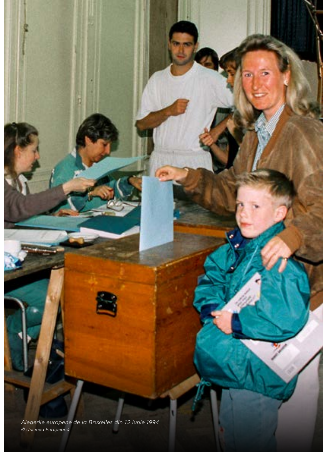
Alegerile europene de la Bruxelles din 12 iunie 1994

Prezența la vot a fost de circa 57 %. Germanul Klaus Hänsch a fost ales președinte al Parlamentului European în 1994. Spaniolul José María Gil-Robles a devenit apoi președinte în 1997, pentru a doua jumătate a legislaturii. Deoarece, pe 1 ianuarie 1995, Uniunea Europeană se extinsese de la 12 la 15 state membre, Austria, Suedia și Finlanda și-au ales reprezentanții în cadrul unor alegeri parțiale în 1995 și 1996. Acești noi deputați au venit cu o tradiție puternică de nealinieră și standarde sociale și de mediu ridicate. Lumea întreagă a început să privească cu alți ochi Europa: o narațiune nouă, optimistă, luase avânt pe Bătrânul Continent, iar modelul european părea destinat să îl depășească pe cel al fostelor blocuri ale Războiului Rece.