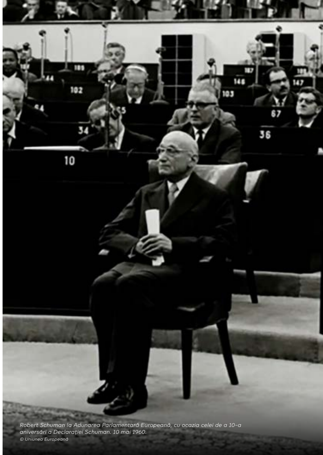
Robert Schuman la Adunarea Parlamentară Europeană, cu ocazia celei de a 10-a aniversări a Declarației Schuman. 10 mai 1960.

În 1958 au fost create alte două Comunități Europene: Comunitatea Economică Europeană și EURATOM. Însăși persoana care a susținut public și a anunțat lumii planul lui Monnet pentru o Europă unită, fostul prim-ministru francez și ministru de externe Robert Schuman, a devenit președintele noii legislaturi, care reunea reprezentanții tuturor celor trei comunități: Adunarea Parlamentară Europeană.