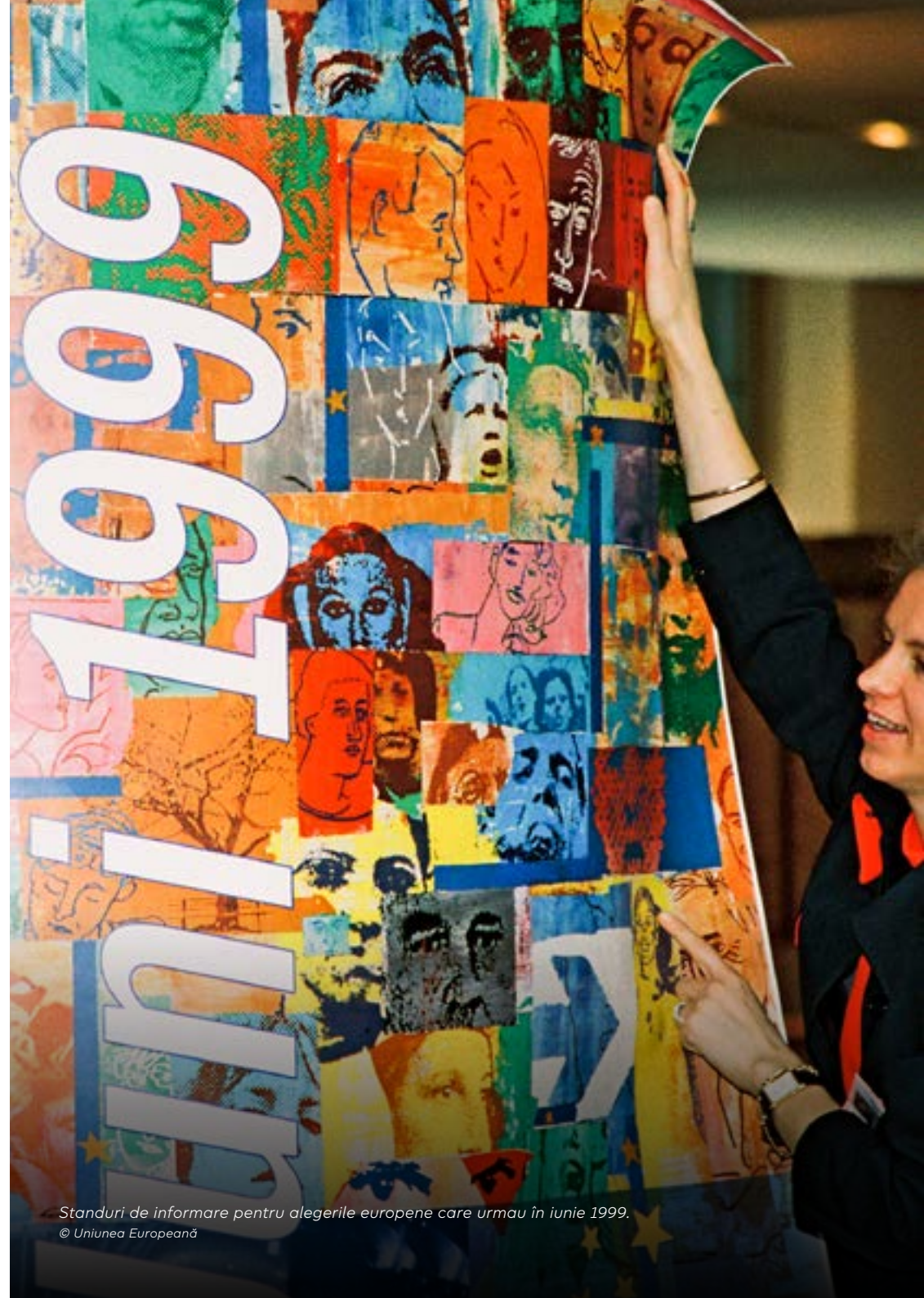
Standuri de informare pentru alegerile europene care urmau în iunie 1999.

Prezența la vot a fost de 58 %. Politiciana franceză Nicole Fontaine a fost aleasă președintă a Parlamentului European în 1999 pentru prima jumătate a legislaturii, iar politicianul irlandez Pat Cox a preluat funcția în 2002 pentru a doua jumătate a legislaturii. Parlamentul a fost martor al intrării în circulație a monedei euro pe 1 ianuarie 2002 și al instituirii unei convenții pentru elaborarea Constituției europene, dar și al unor provocări majore la adresa rolului Uniunii Europene de actor pe scena mondială. Atacurile din 11 septembrie 2001 de la New York și Washington au adus în prim-plan, mai puternic ca niciodată, lupta împotriva terorismului. Invadarea Irakului de către SUA a împărțit Uniunea în două grupuri de țări: cele care au fost de partea Statelor Unite și cele care au criticat invazia. S-a ajuns până la un clivaj între „Vechea Europă” și „Noua Europă”, în care fiecare dintre tabere respingea ferm argumentele celeilalte!