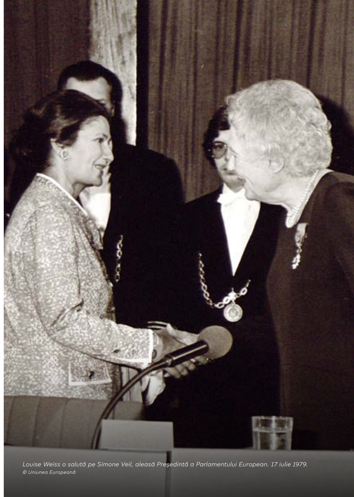
Louise Weiss o salută pe Simone Veil, aleasă Președintă a Parlamentului European. 17 iulie 1979.

În a doua parte a legislaturii parlamentare, începând cu 1982, Piet Dankert, din Țările de Jos, a ocupat funcția de președinte.