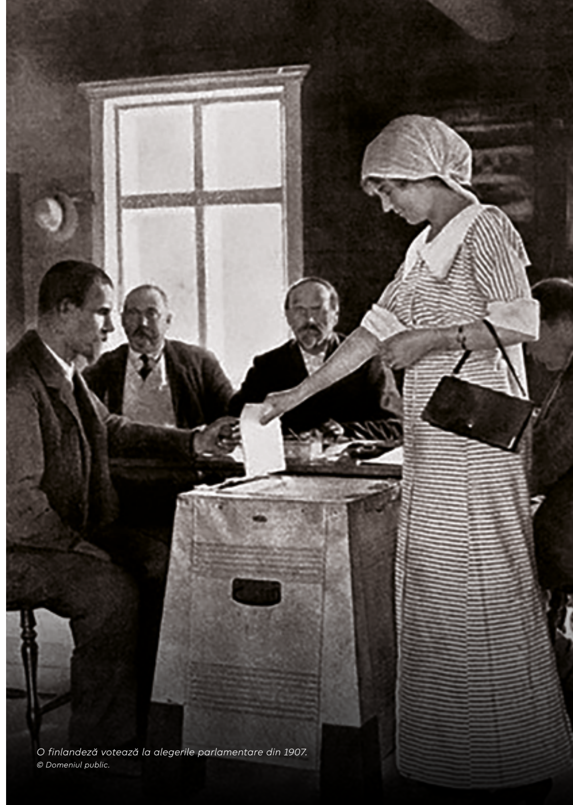
O finlandeză votează la alegerile parlamentare din 1907.

Un lucru este însă clar în zilele noastre: alegerile nu pot fi pe deplin democratice fără aplicarea votului universal. În Europa, alegerile prin vot universal au fost organizate prima dată la începutul secolului al XX-lea, în principal în țările scandinave și în alte țări din nordul Europei. În restul Europei, a durat uneori foarte mult până când femeile au obținut drept de vot. În Elveția, de exemplu, acest lucru s-a petrecut de abia în anii '70, în timp ce în Spania și Turcia femeile au început să voteze în anii '30. Perioada de glorie a democrației liberale a fost, de asemenea, momentul în care au luat naștere și cele mai grave provocări la adresa ei: nazismul