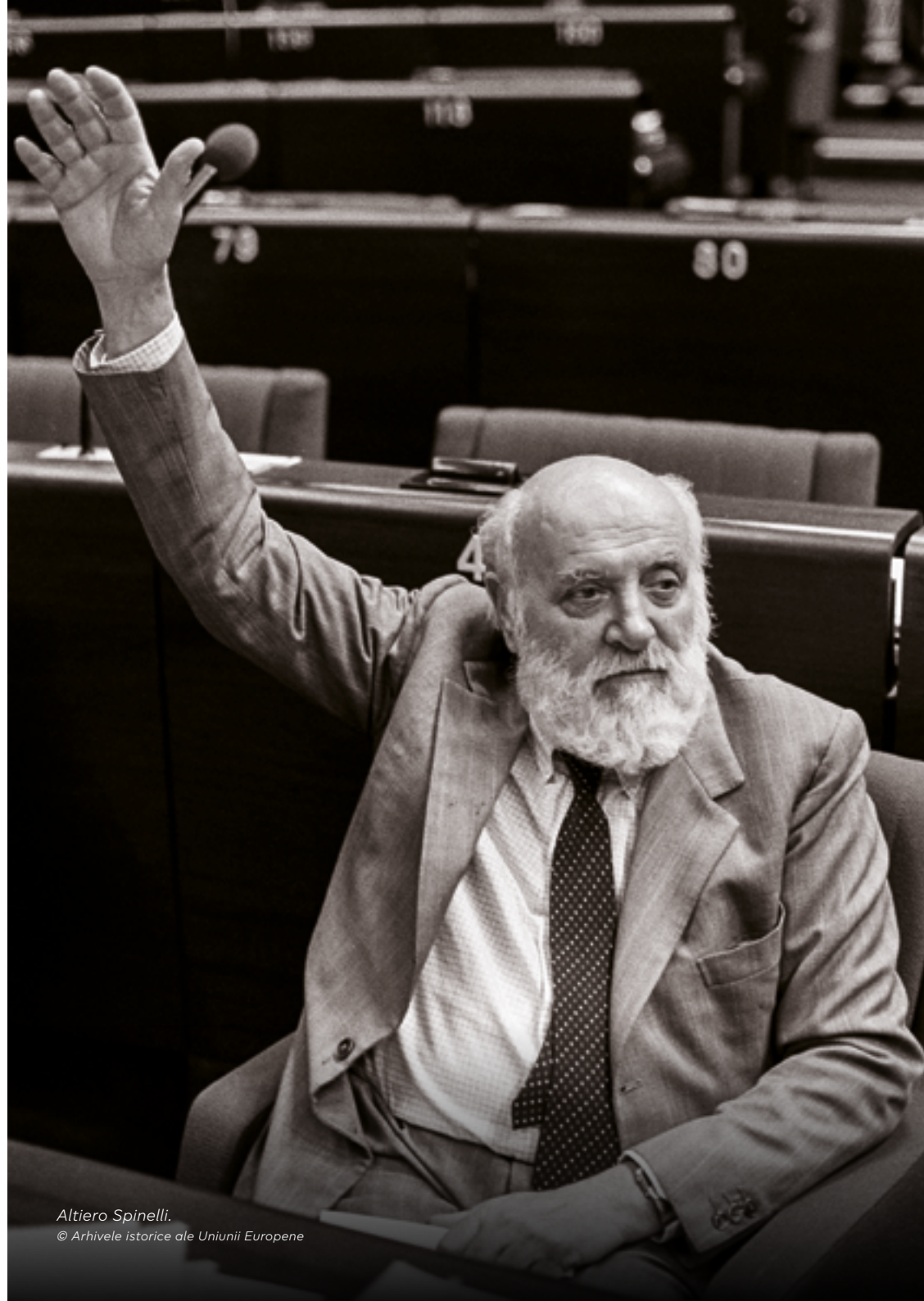
Altiero Spinelli.

Tot pentru prima dată, Grecia a participat la alegerile europene în calitate de nou stat membru. Cu o prezență la urne de 59 %, Pierre Pflimlin din Franța a fost ales președinte al instituției, devenind primul fost prim-ministru al unui stat membru care a ajuns în fruntea Parlamentului European. Charles Henry Plumb, din Regatul Unit, i-a urmat în funcția de președinte în 1987. După ce Spania și Portugalia au aderat la Comunitatea Europeană la jumătatea legislaturii parlamentare, au fost prevăzute alegeri parțiale în 1987. Deși statele membre nu au aprobat, în cele din urmă, proiectul de Tratat de instituire a unei Uniuni Europene, textul a pregătit terenul pentru marile schimbări care au urmat, cum ar fi aprobarea Actului Unic European și, în cele din urmă, crearea Uniunii Europene.