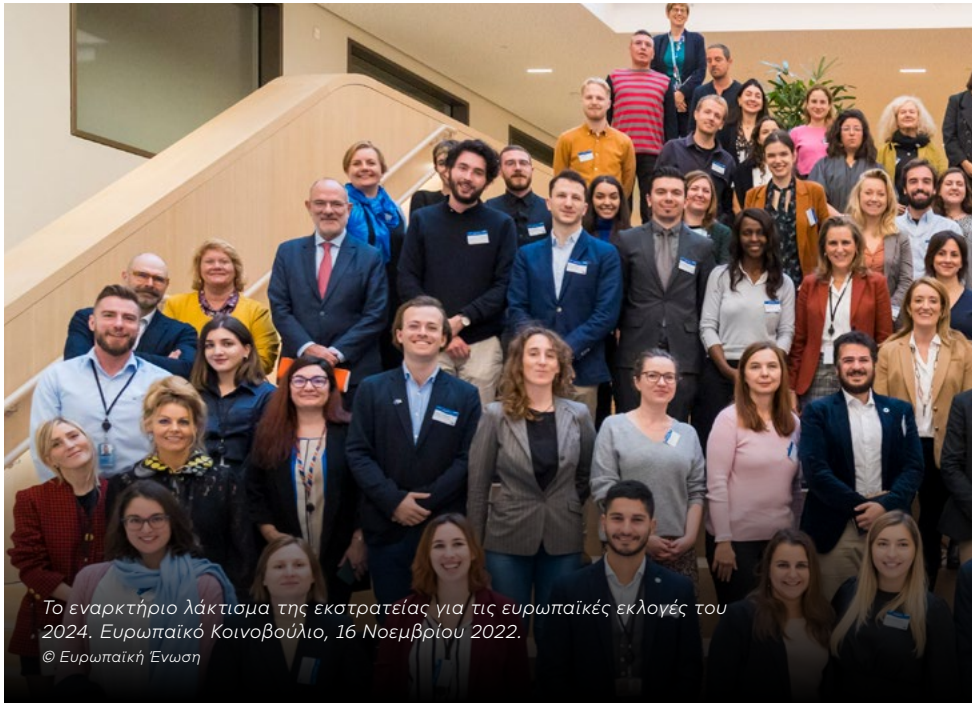
Το εναρκτήριο λάκτισμα της εκστρατείας για τις ευρωπαϊκές εκλογές του 2024. Ευρωπαϊκό Κοινοβούλιο, 16 Νοεμβρίου 2022.