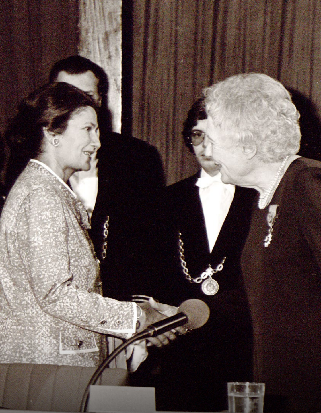
Η Λουίζ Βάις συγχαίρει τη Σιμόν Βέιγ, νεοεκλεγείσα πρόεδρο του Ευρωπαϊκού Κοινοβουλίου. 17 Ιουλίου 1979