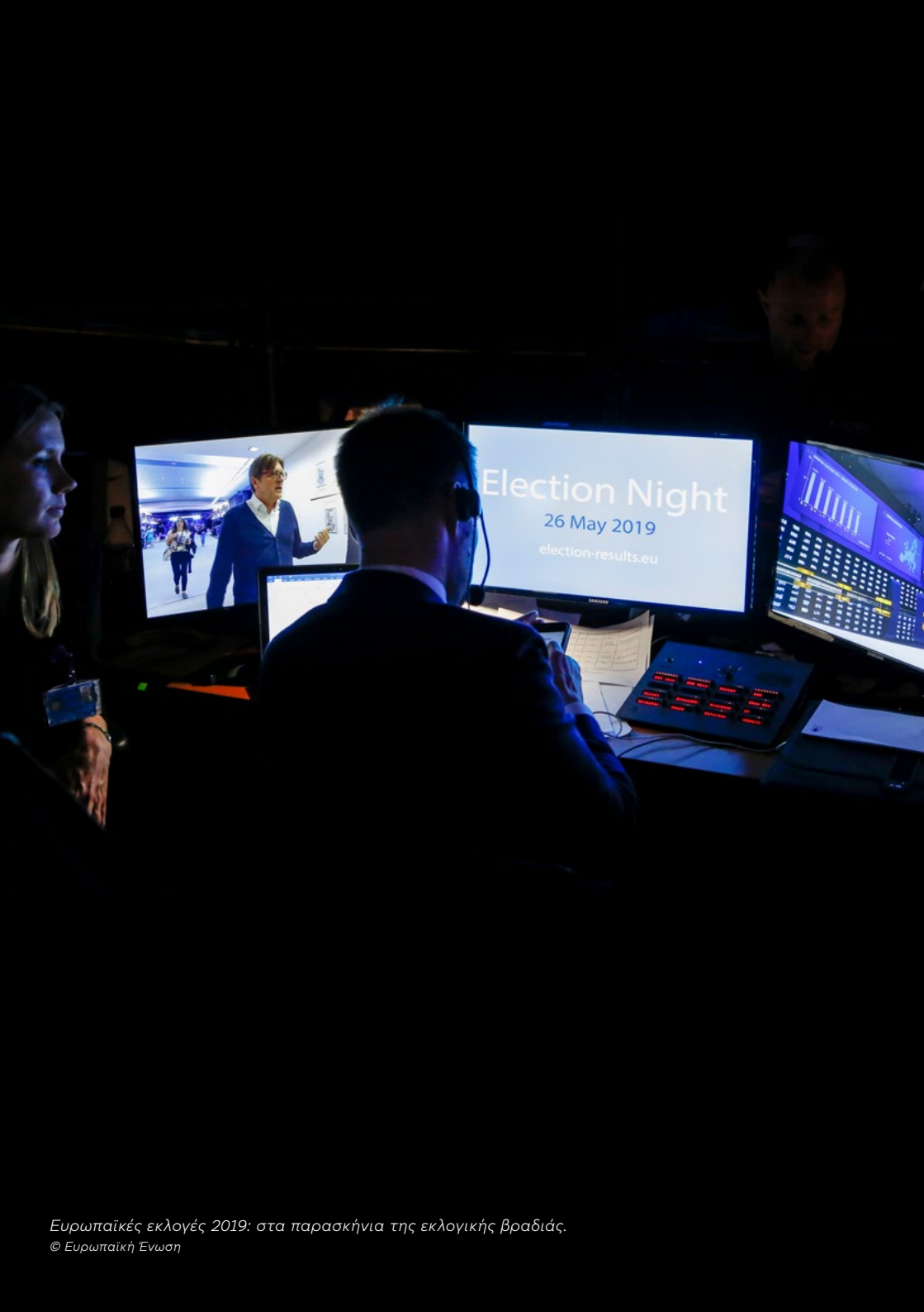
Ευρωπαϊκές εκλογές 2019: στα παρασκήνια της εκλογικής βραδιάς.