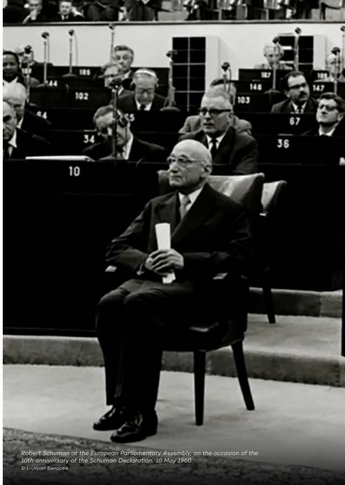
Robert Schuman at the European Parliamentary Assembly, on the occasion of the 10th anniversary of the Schuman Declaration. 10 May 1960.

Fl-1958 inħolqu żewġ Komunitajiet Ewropej oħra: il-Komunità Ekonomika Ewropea u l-EURATOM. L-istess bniedem li kien approva u ħabbar pubblikament lill-bqija tad-dinja l-pjan ta' azzjoni ta' Monnet għal Ewropa magħquda, l-ex Prim Ministru Franciż u l-Ministru għall-Affarjiet Barranin Robert Schuman, sar il-president tal-legiżlatura l-ġdida li kienet tiġbor fi ħdanha rappreżentanti tat-tliet Komunitajiet kollha kemm huma: l-Assemblea Parlamentari Ewropea.