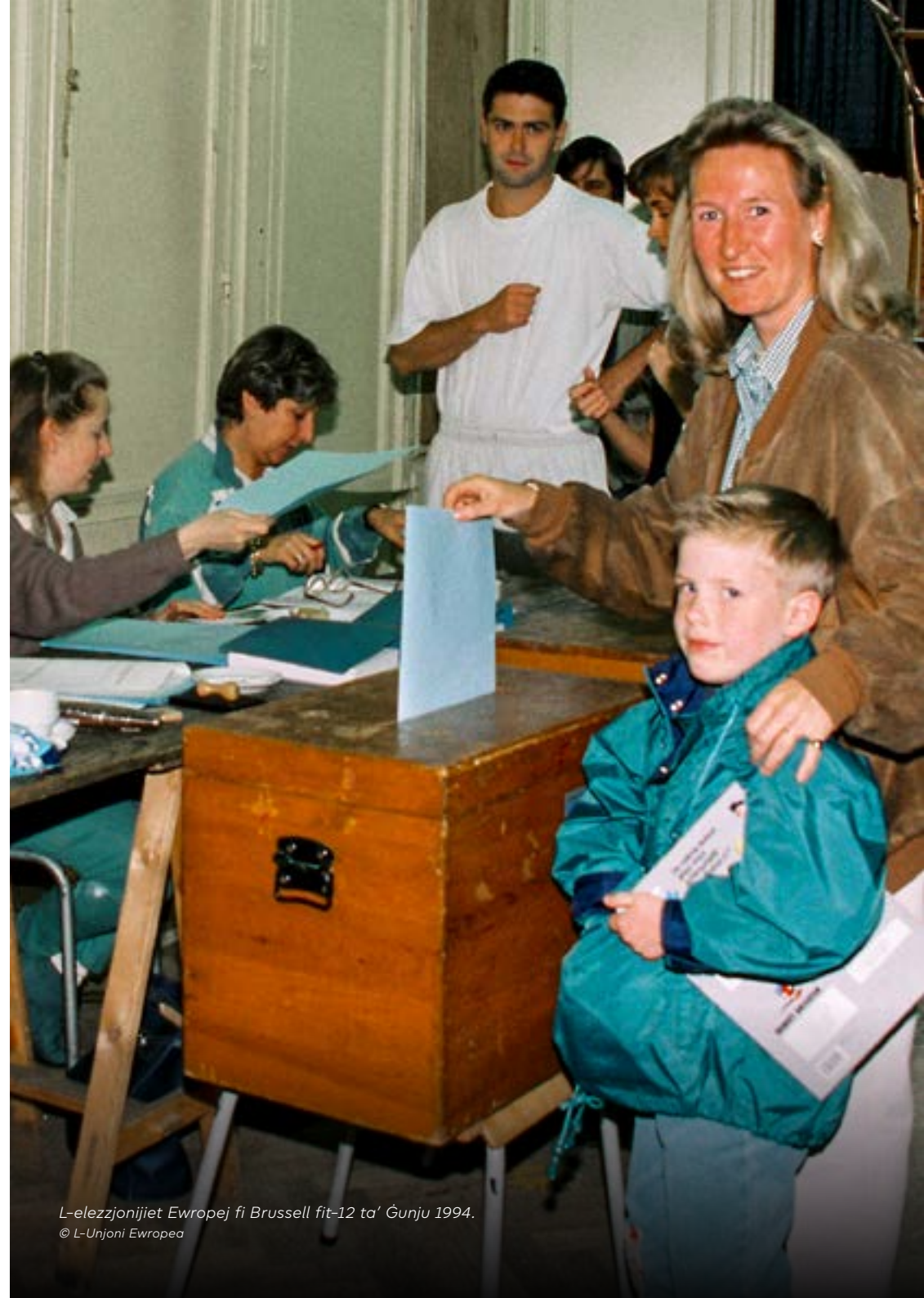
L-elezzjonijiet Ewropej fi Brussell fit-12 ta' Ġunju 1994.

Il-parteciċipazzjoni kienet ta' madwar 57 %. Il-Ġermaniż Klaus Hänsch ġie elett President tal-Parlament Ewropew fl-1994. L-Ispanjol José María Gil-Robles imbagħad sar President għat-tieni nofs tal-leġiżlatura fl-1997. Peress li fl-1 ta' Jannar 1995 l-UE kienet kibret minn 12 għal 15-il Stat Membru, l-Awstrija, l-Iżvezja u l-Finlandja elegġew ir-rappreżentanti tagħhom f'elezzjonijiet parzjali matul l-1995 u l-1996. Dawn il-Membri ġodda fjamanti ġabu magħhom tradizzjoni qawwija ta' nuqqas ta' allinjament kif ukoll standards soċjali u ambjentali għoljin. Id-dinja kienet qed tħares ukoll lejn l-Ewropa ta' lenti ġdida: narrativa ġdida mimlija ottimizmu kienet f'jorixxiet fid-Dinja l-Qadima, u l-mudell Ewropew deher li kien se jkollu prestazzjoni aħjar mill-prestazzjoni ta' dawk li qabel kienu l-blokki tal-Gwerra Bierda.