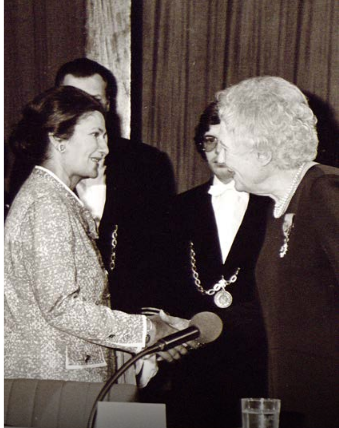
Louise Weiss tilqa' lil Simone Veil li kienet għadha kif ġiet eletta bħala President tal-Parlament Ewropew. 17 ta' Lulju 1979.

Fit-tieni parti tal-leġiżlatura, li bdiet fl-1982, il-President kien Piet Dankert min-Netherlands.