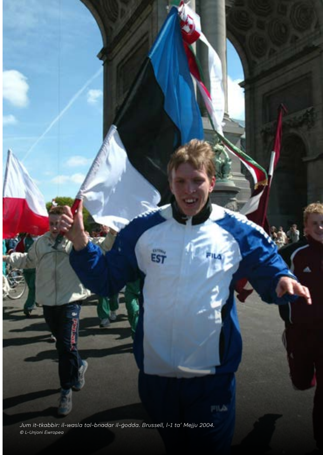
Jum it-tkabbir: il-wasla tal-bnadar il-ġodda. Brussell, l-1 ta' Mejju 2004.

Madankollu, mhux il-progress kollu li kien sar biex l-Ewropa tingħata sura ġdida nħela: Wara ċ-ċaħda tat-Trattat Kostituzzjonali, kien hemm perjodu ta' riflessjoni. X'kellu jkun il-pass li jmiss? Id-Dikjarazzjoni ta' Berlin, iffirmata b'mod kongunt f'Marzu 2007 mill-President Pöttering, salvat ħafna mid-dispożizzjonijiet tat-Trattat Kostituzzjonali fil-ħin għall-elezzjoni li jmiss, fil-forma ta' dak li mbagħad sar it-Trattat ta' Liżbona (inizjalment magħruf bħala t-Trattat ta' Riforma).